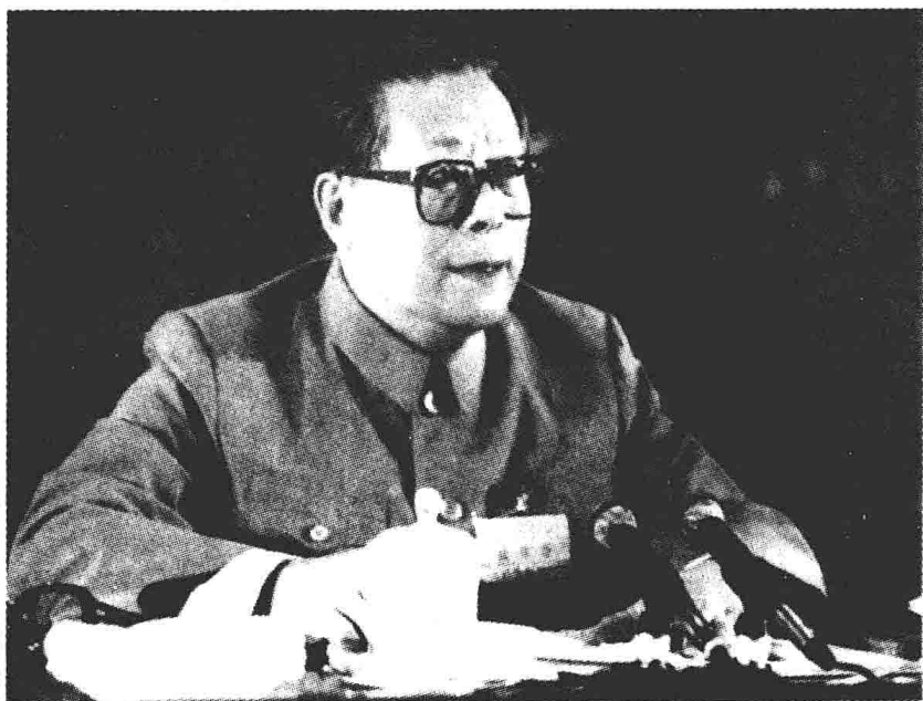
江泽民总书记在中共十三届四中全会上讲话。