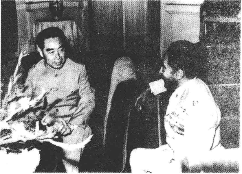
周恩来访问埃塞俄比亚同海尔·塞拉西一世皇帝 交谈。