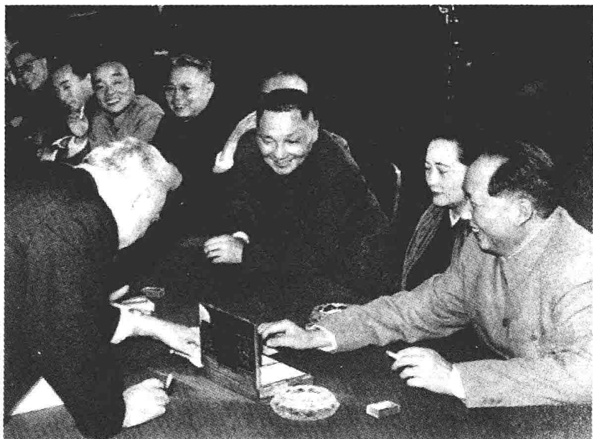
1957年11月，邓小平、宋庆龄等随毛泽东率领的中国代表团赴前苏联参加十月革命40周年庆典期间，拜会苏联部长会议主席布尔加宁（左）。