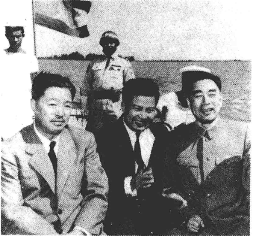
1956年11月17日至21日，周恩来访问越南。