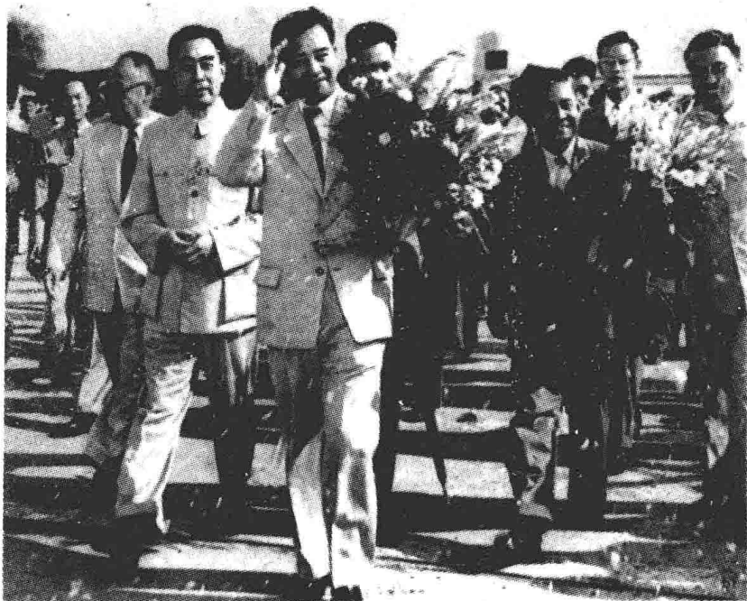
1956年8月20日至26日，老挝首相梭发那·富马亲王率老挝政府代表团访问中国。图为周恩来、陈毅等到机场欢迎。