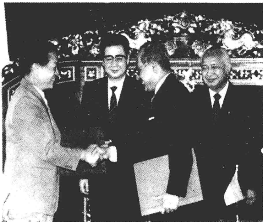
1990年8月8日，中国同印度尼西亚共和国恢复外交关系。图为两国外长在复交谅解备忘录签字后交换文本。左起：钱其琛、李鹏、印尼外长阿里·阿拉塔、印尼总统苏哈托。