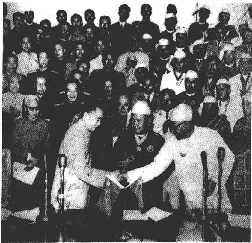
1960年10月1日，中国、缅甸在北京签订了中 缅两国边界条约，解决了中缅之间悬而未定的边界问 题。1961年1月14日，在缅甸总统府举行了互换中 缅边界条约批准书的仪式。图为周恩来和缅甸总理吴 努在签字仪式上。