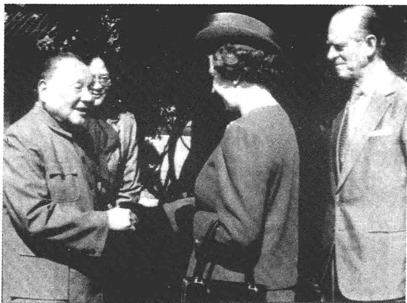
1986年10月英国女王伊丽莎白二世应邀来中国访问。邓小平会见女王夫妇。