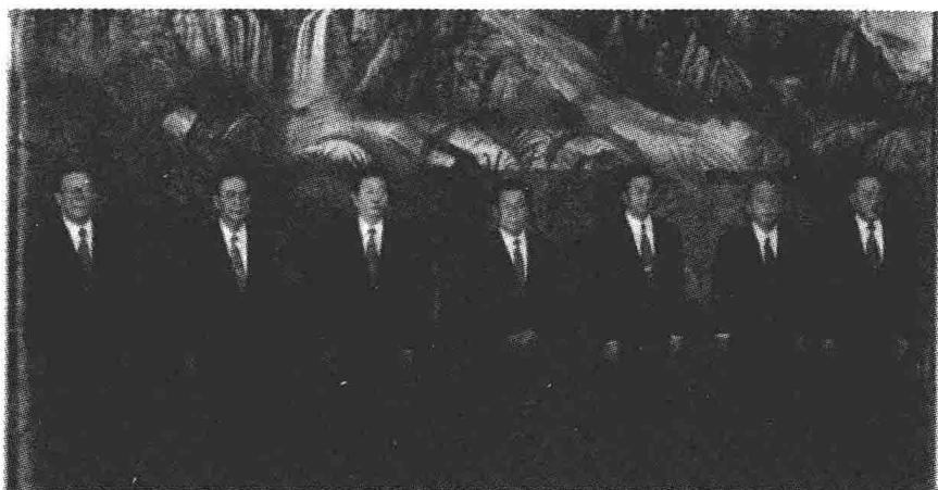
在中共十五届一中全会上新当选的中央政治局常委江泽民、李鹏、朱镕基、李瑞怀、胡锦涛、尉建行、李岚清（自左至右）。