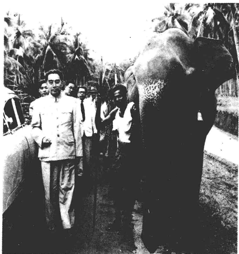
1957年1月31日至2月5日，周恩来访问锡兰（今斯里兰卡）时参观农村。