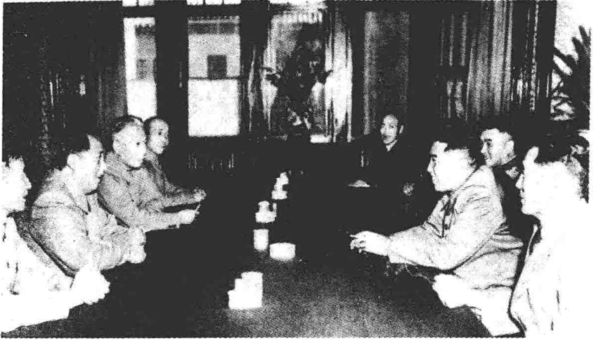
1954年10月，朝鲜民主主义人民共和国政府代表团应邀访问中国。图为毛泽东会见金日成首相。