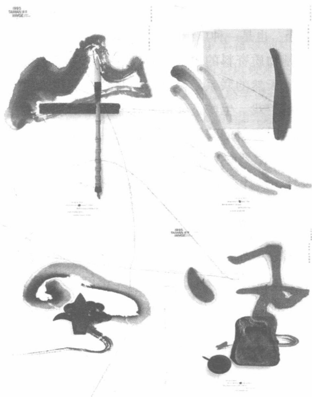
图 1-4 靳埭强“山”“水”“风”“云”系列招贴设计

可以说，设计活动是人类通过文化对自然物的人工组合，而且总是以一定的文化形态为中介。因此，设计必定表现为某种文化创造形态，这是由特定的文化背景以及进行设计活动的、具有特殊文化素质的人所决定的。