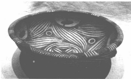
图 1-1 仰韶文化之旋涡纹彩陶盆

在中国先秦时期，《周易·系辞下传》中有“观鸟兽之文与地之宜，近取诸身，远取诸物，于是始作八卦，以通明神之德，以类万物之情”的论断，表现出中国古人的自然观念为：人在造物中，借助自然的法则，“近取诸身，远取诸物”，来达到和完成自身的理想，如图 1-1 所示。