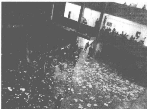
图 1 2012 年 3 月 9 日晚，湘机中学学生集体烧书、丢书、撕书现场

学校为了提高升学率和增加教师的福利，要求教师不断地为学生补课，这样一来苦了学生，致使他们厌恶读书（见图 2）。