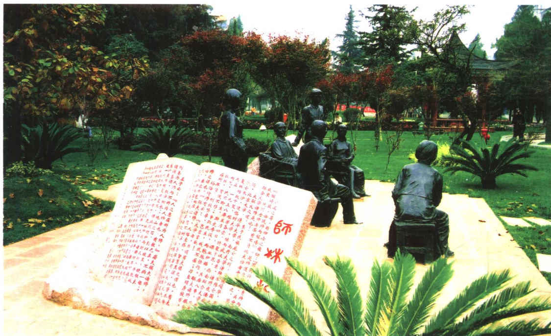
师林记(校园文化景点之一)

师道之尊,苟卿论之最切:“国将兴,必贵师而重傅”;“国将衰,必贱师而轻傅”。是师道之兴废,关乎国运之盛衰。然则为师者果有不负此人任者乎?有之,国立西南联合大学诸师是也!