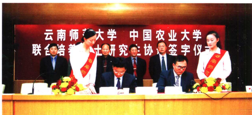
图为双方签定协议