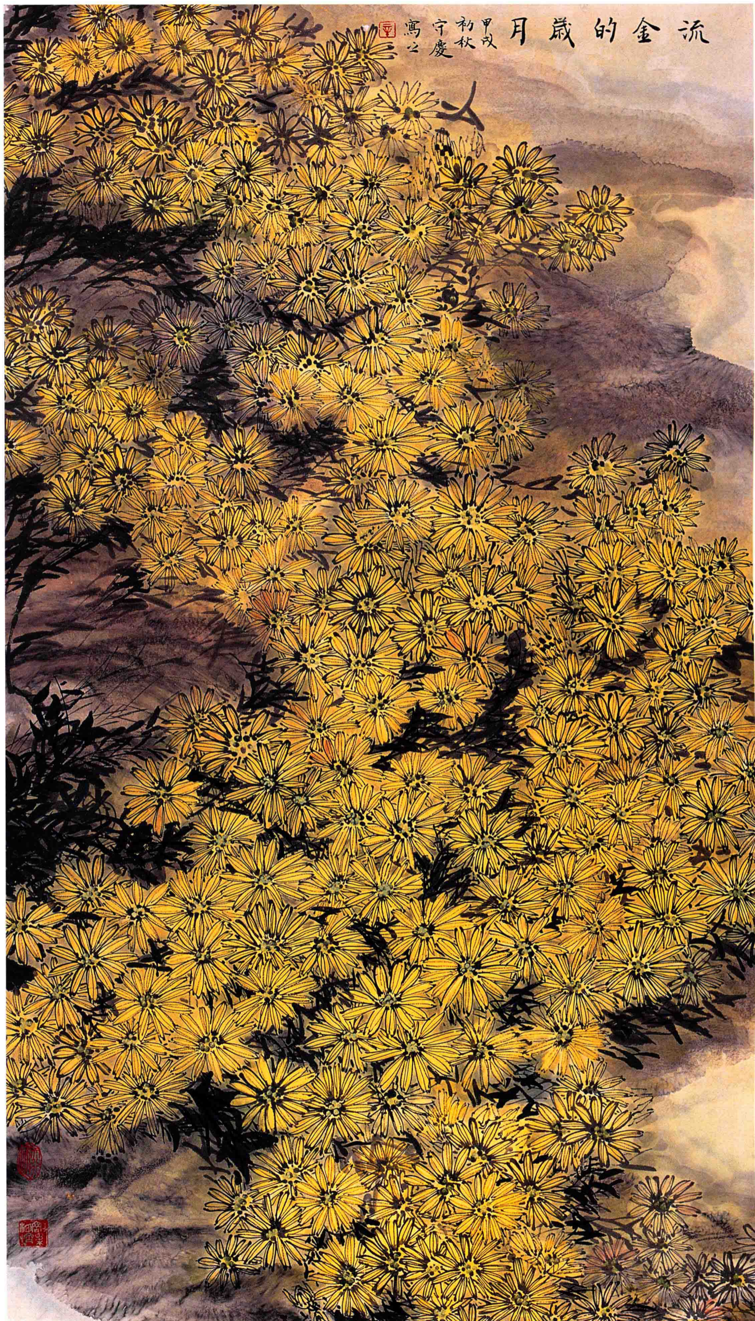
流金的岁月 180cm x 90cm