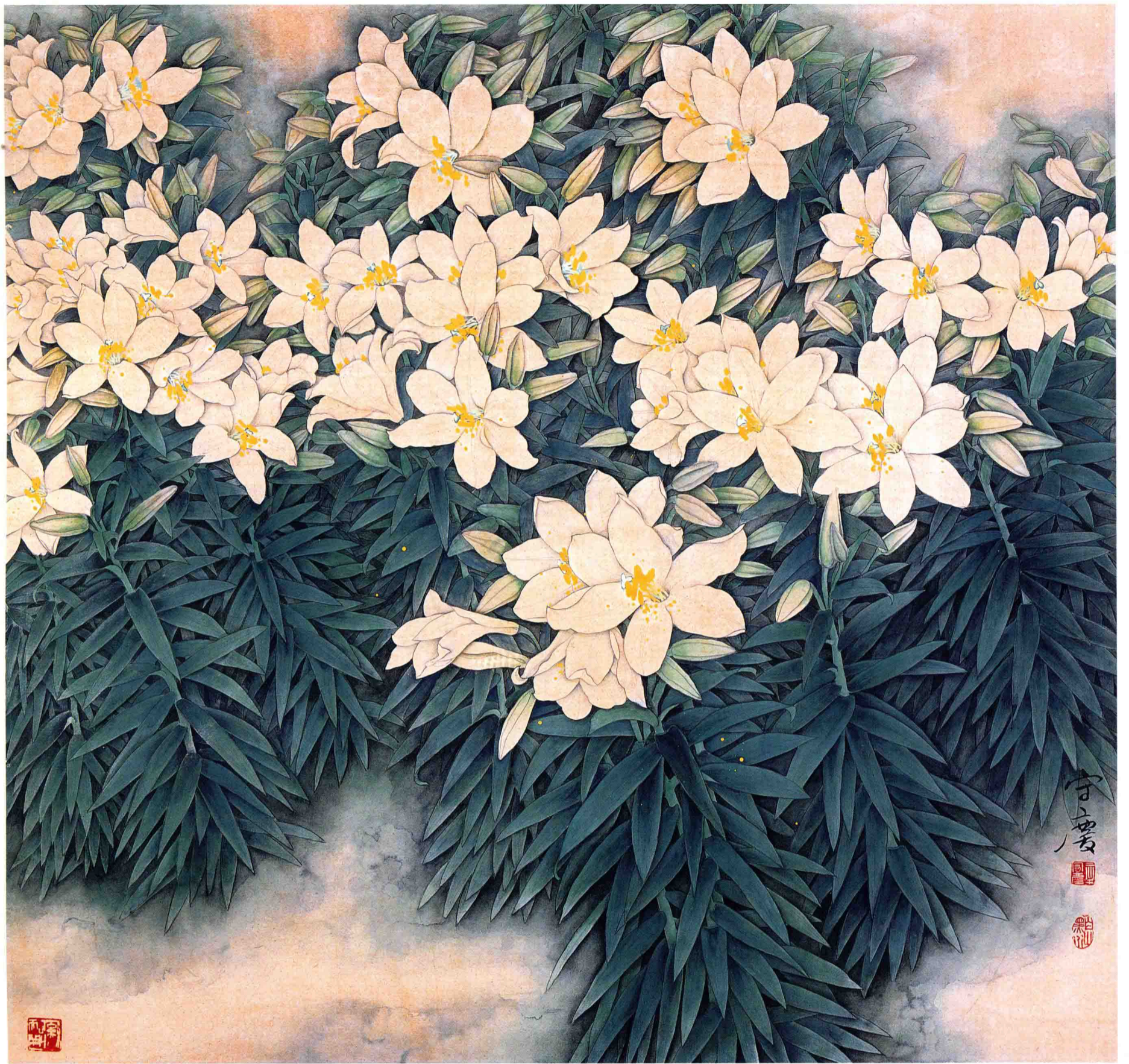
百合花 90cm x 90cm