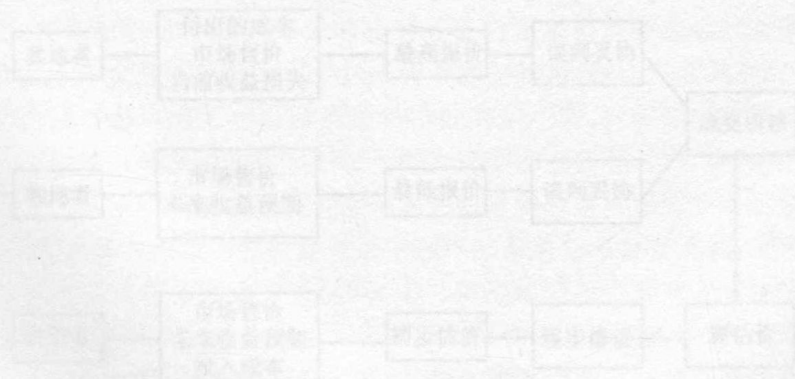
图 1-1 估价过程流程图

从技术层面上讲,土地估价仅仅是对土地客观属性的一种度量,是估价师在充分掌握市场环境状况的基础上,通过分析,根据不同的估价目的或估价对象,并依据一定的原则、原则和方法,将土地价格描述和表达出来这样一个过程。估价师对土地客观属性进行测量的角度以收益为基础对土地价值进行测量,也可以从土地开发者的角度以开发成本为基础对土地价值进行测量,还可以从房屋开发者的角度以房屋开发的价值为基础对土地价值进行测量。但是,无论采用什么方式对土地价值进行判断和表达,都必须建立在对土地条件和市场环境进行了充分了解的基础上。所以,在估价活动之中,对土地条件和市场环境的充分了解和分析,是估价师进行土地估价过程的关键。土地估价过程如图1-1所示。