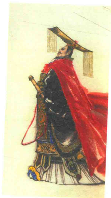
秦始皇 王西京 作