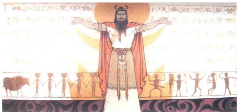
轩辕黄帝 曹天舒 作