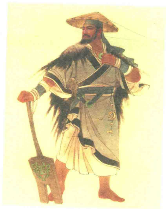
大禹 张旺 作