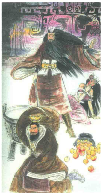
武王伐纣 王丽红 作