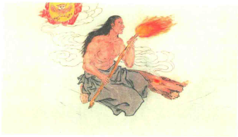
燧人 王浩洋 作