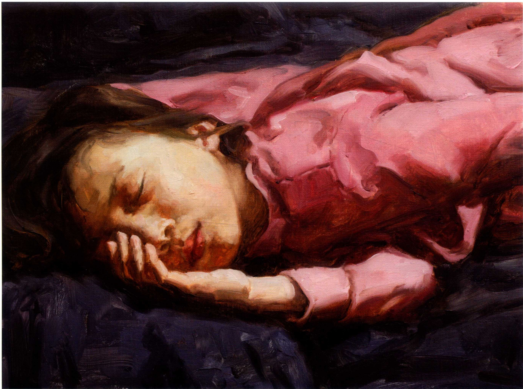
憩 40cm × 30cm 2015 年