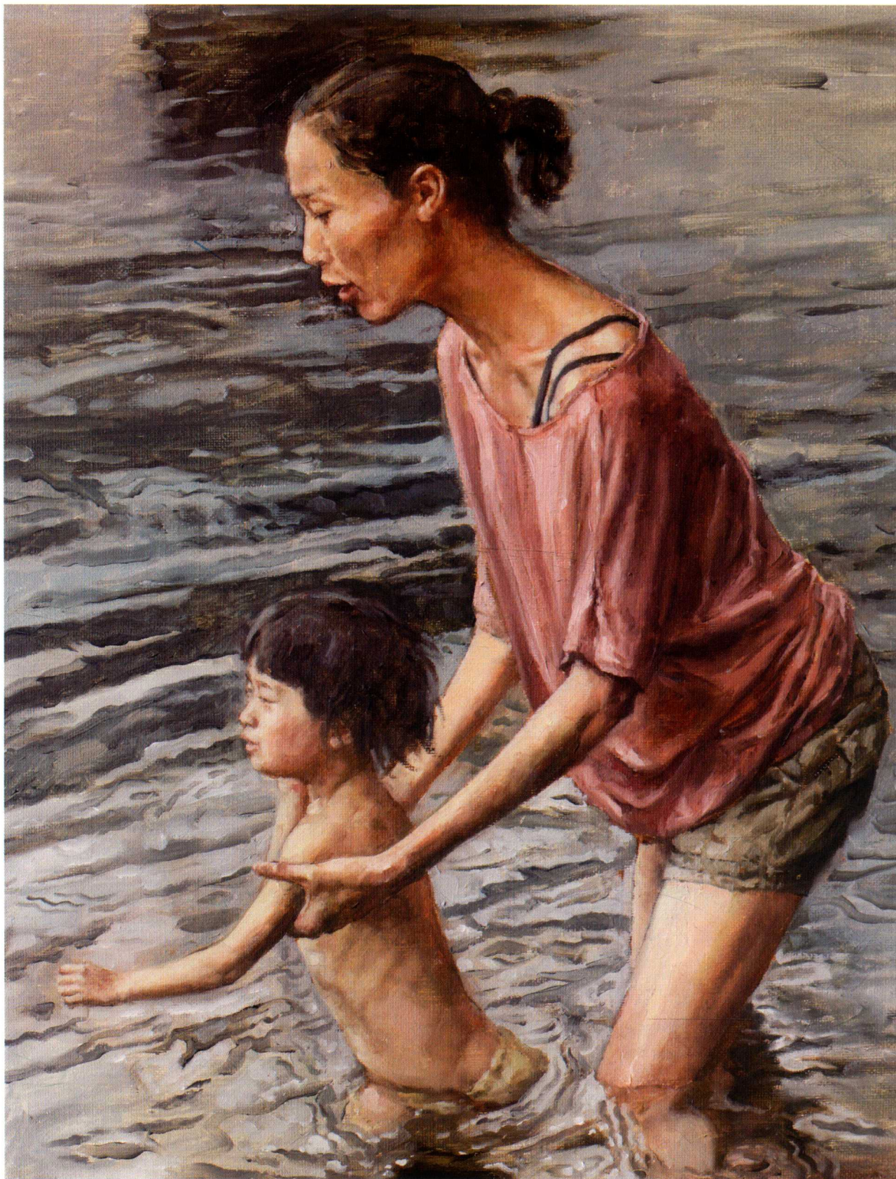
小河边 30cm × 40cm 2015 年