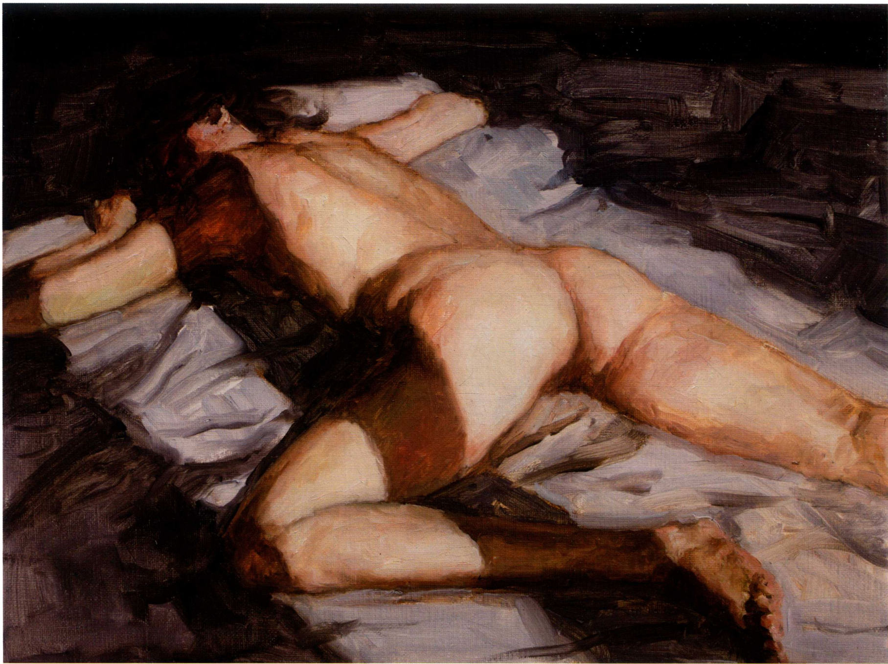
早晨的阳光系列之二 40cm x 30cm 2015年