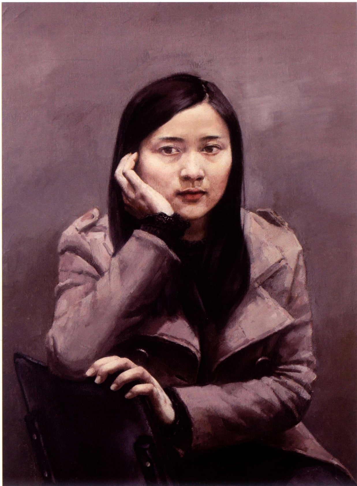
静思 70cm × 100cm 2012 年