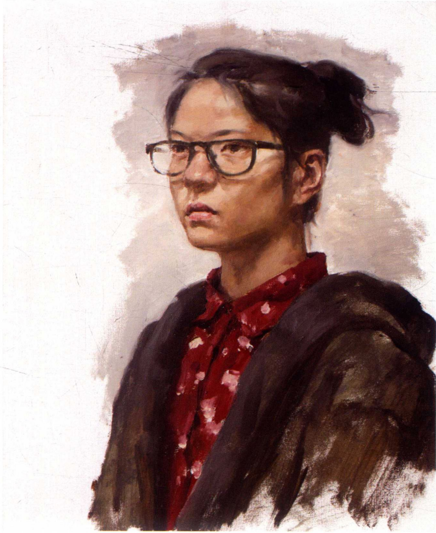
女大学生像 40cm × 50cm 2015年