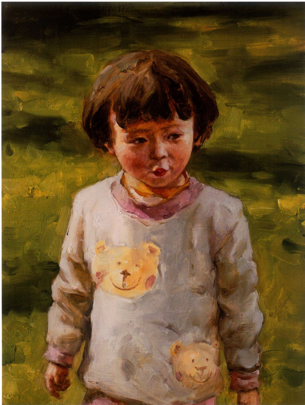
绿茵 30cm × 40cm 2015 年