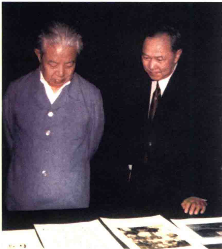
1988年中央党史工作领导小组副组长邓力群与金冲及，摄于中南海