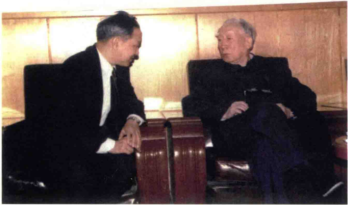
1988年中央党史工作领导小组副组长薄一波与金冲及，摄于中南海