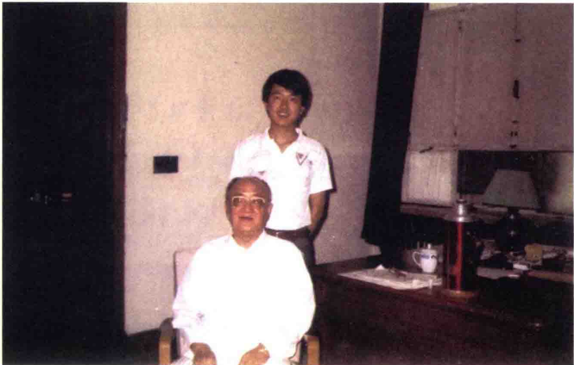
1991年胡绳与金以林，摄于玉泉山