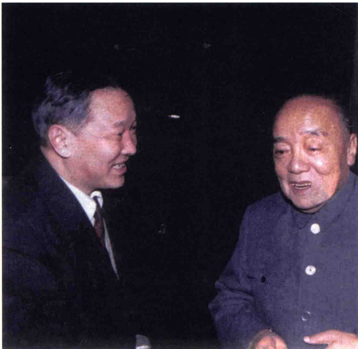
1986年中央党史工作领导小组组长杨尚昆与金冲及，摄于毛家湾