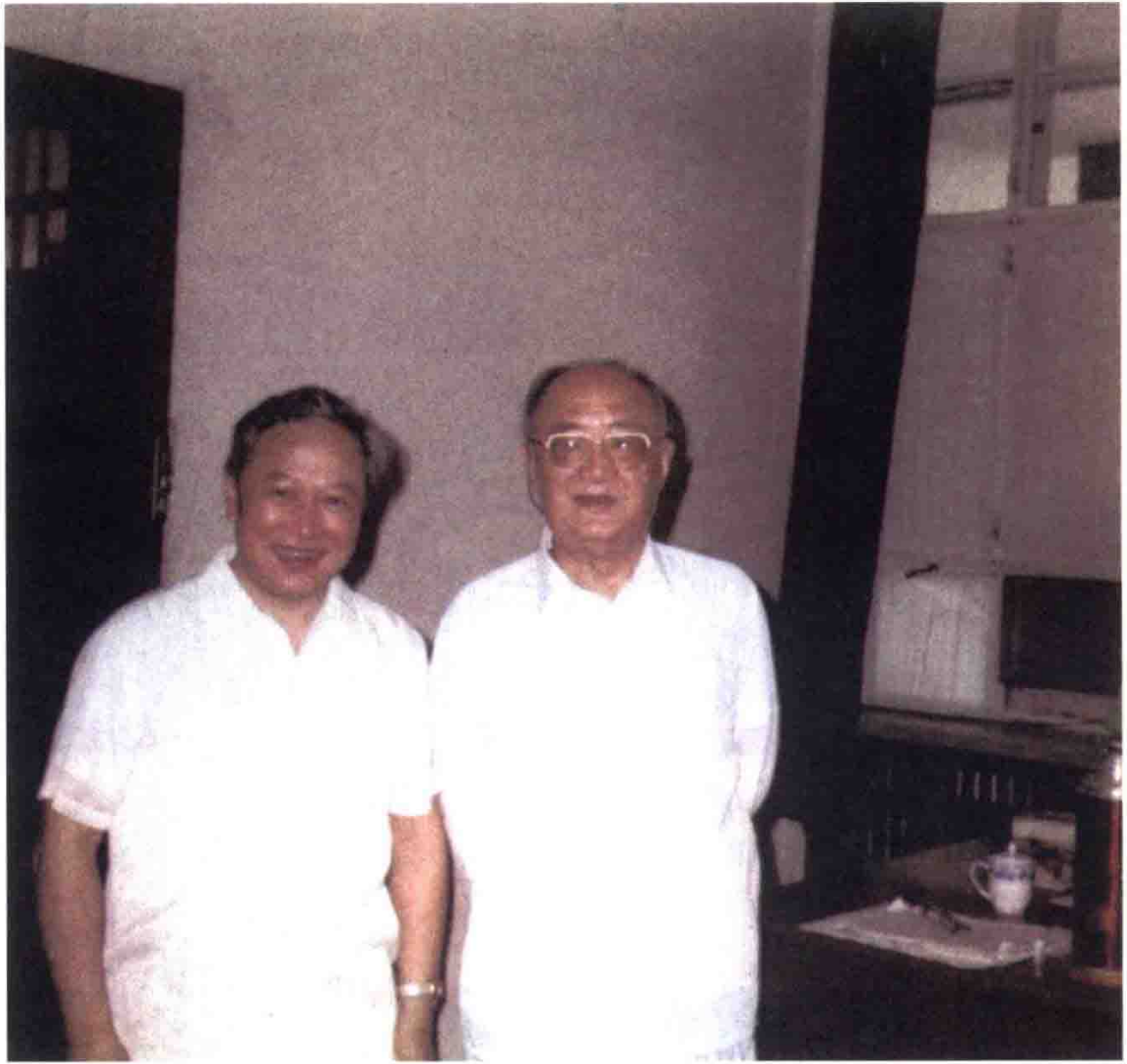
1991年中央党史工作领导小组副组长胡绳与金冲及，摄于玉泉山