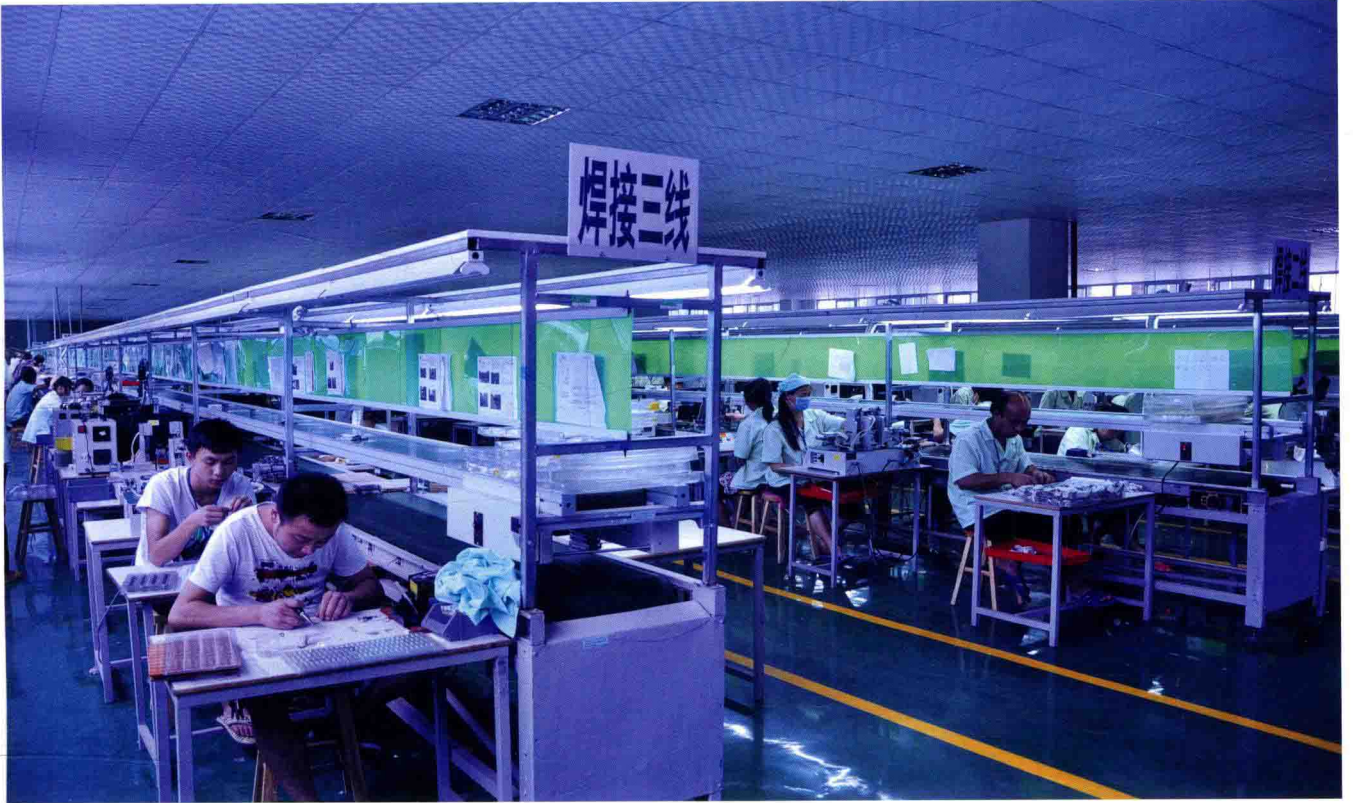
桐梓重庆工业园区车间生产线