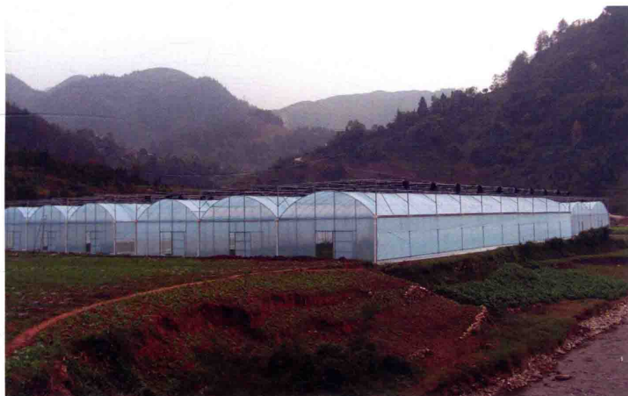
蔬菜产业基地育苗大棚