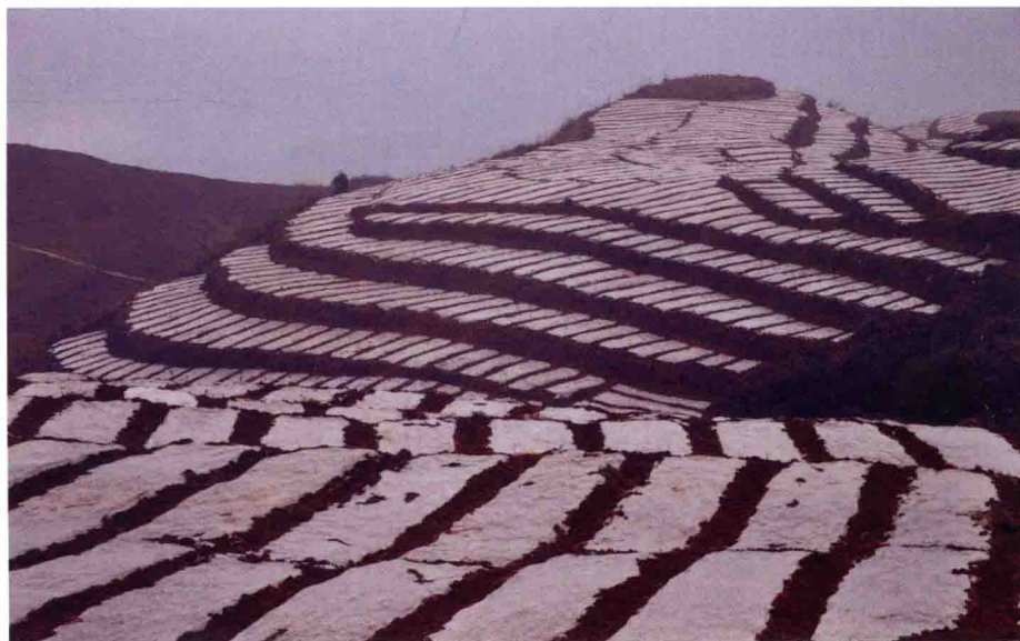
狮溪镇中药材种植