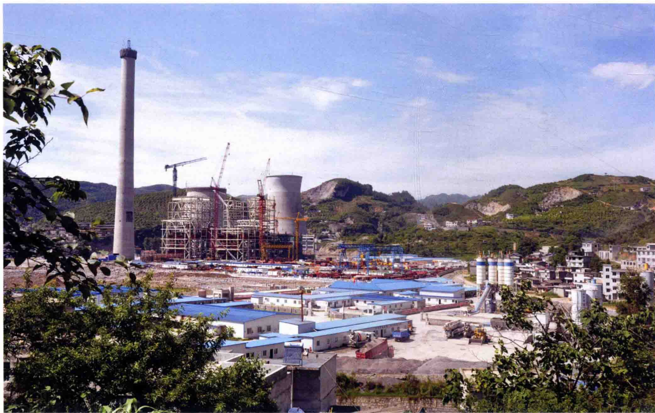
建设中的桐梓电厂