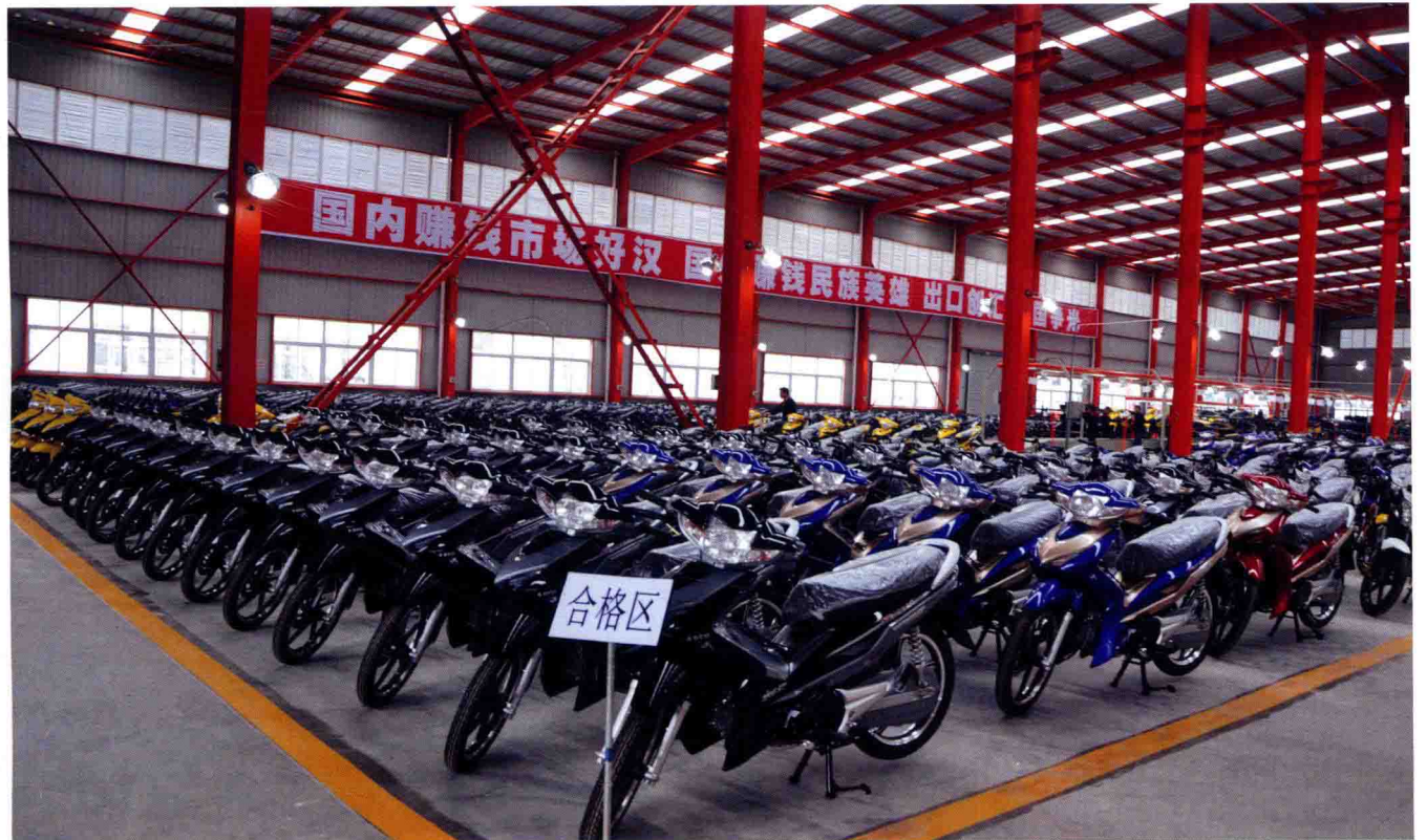
大丰摩托成品展示