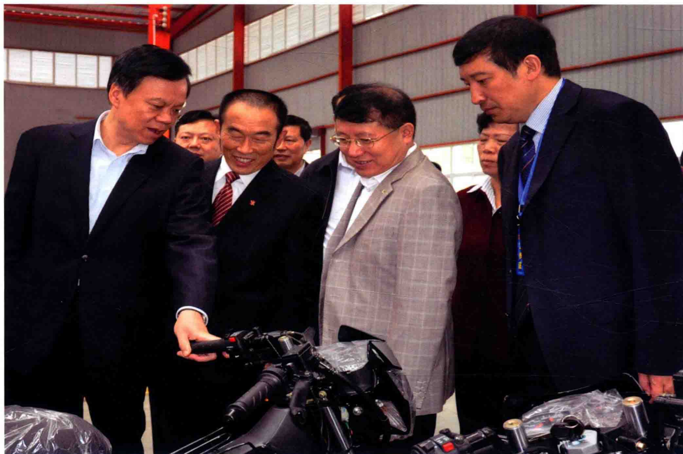
省委副书记陈敏尔（左一）在桐梓重庆工业园区视察