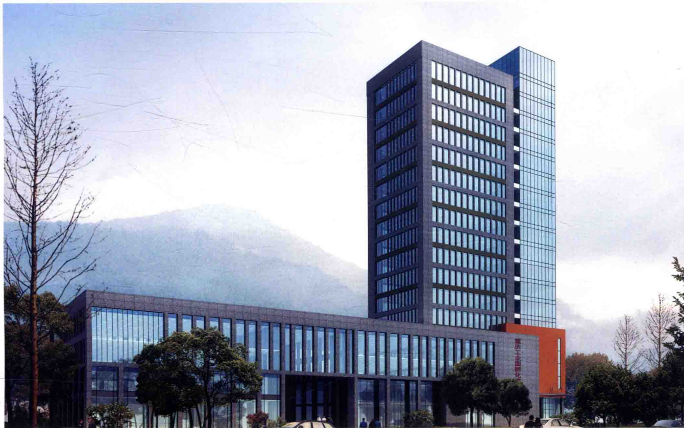
工业园区孵化楼效果图