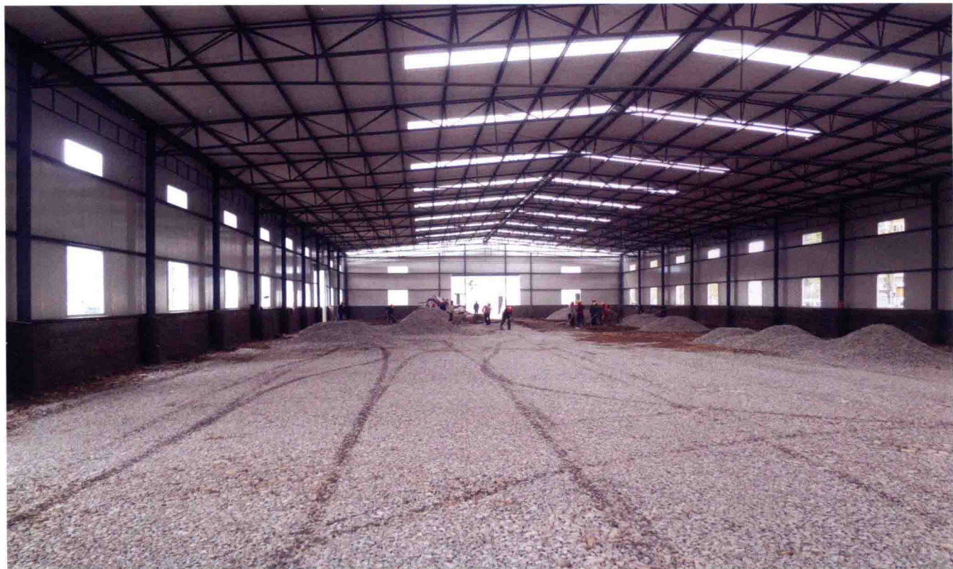
桐梓重庆工业园厂房建设