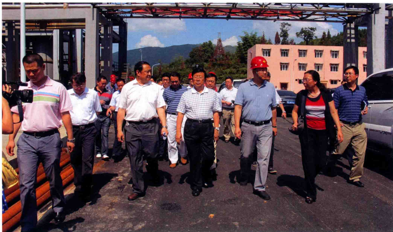
省委副书记、省长赵克志（前排右四）在桐梓遵宝钛业视察