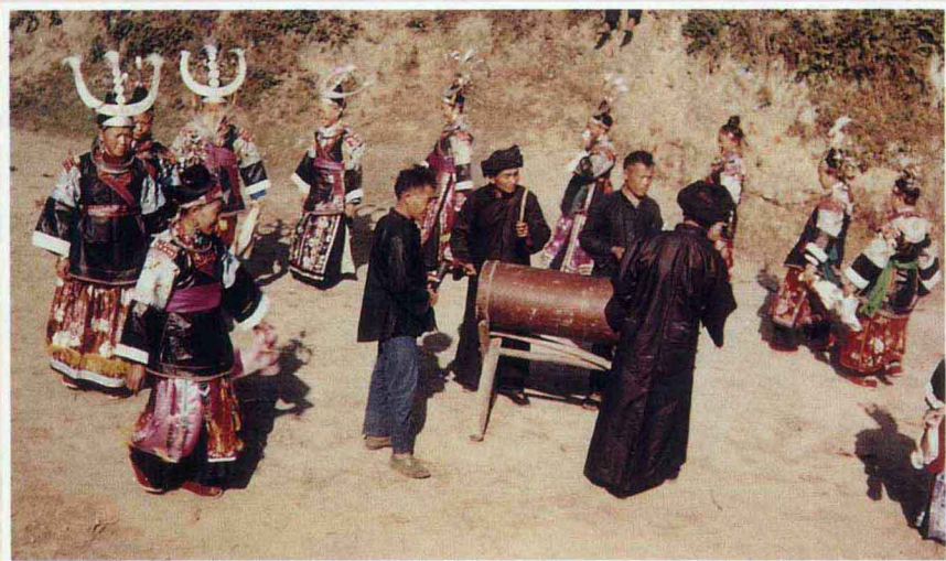
苗族木鼓舞