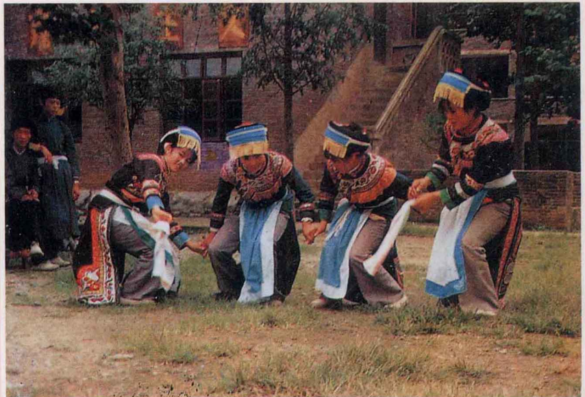
彝族嫁姑娘