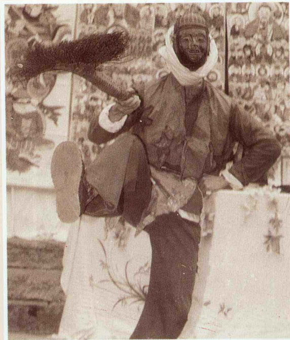
汉族傩舞 省卷编辑部收集