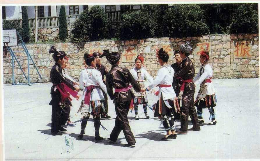
侗族踩歌堂