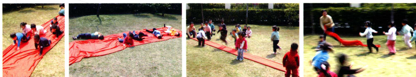
一块大红布,教师开发了多种运动项目让幼儿选择。