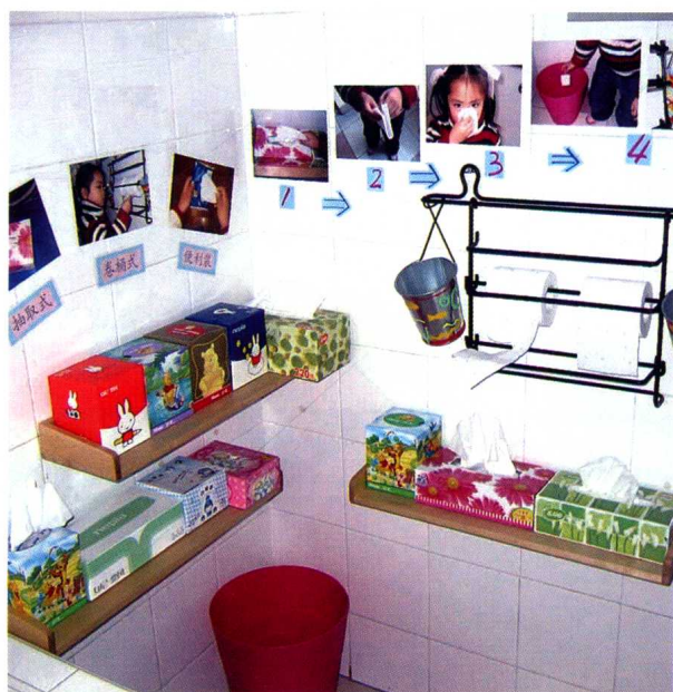
盥洗室里的生活角:餐巾纸的使用