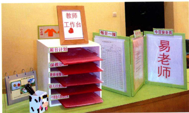
在教师工作台上公示了教师所有的班级工作资料,让家长 and 教师成为幼儿园教育的合作伙伴。