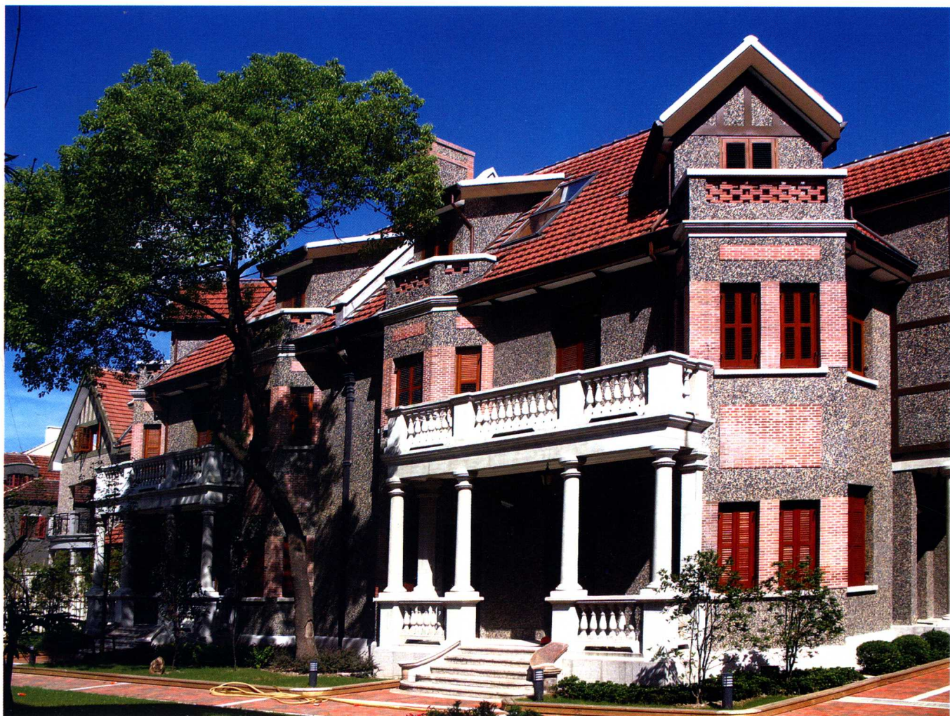
独具法式建筑风格的园舍外墙上布满了小颗粒的鹅卵石,所以孩子们给它取了一个十分形象的名字——芝麻房。