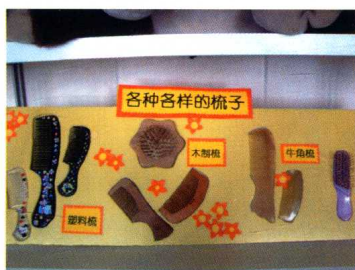
盥洗室里的生活角:各种各样的梳子