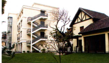
突出立体式阳台的乳白色楼房,孩子们称它“小白楼”。楼前映衬着色彩鲜艳的花朵,孩子们最喜欢在阳台或台阶上一起做游戏,主动为小花浇水。