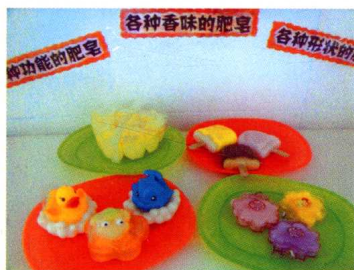
盥洗室里的生活角:肥皂美多多