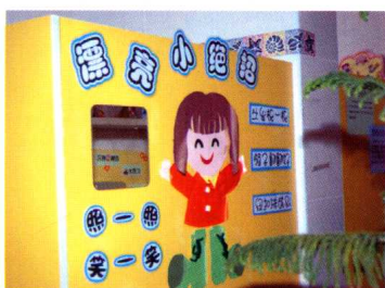
盥洗室里的生活角:漂亮小绝招