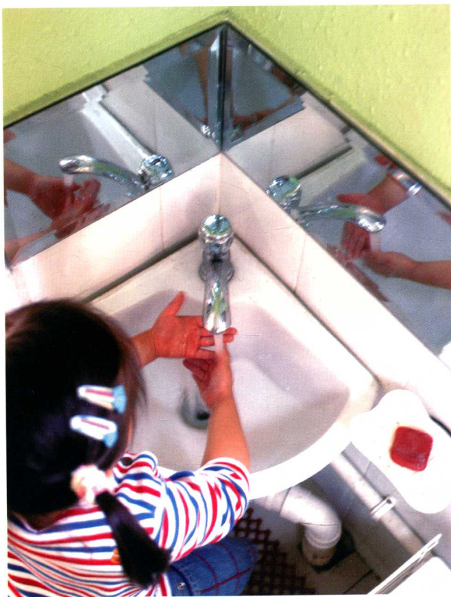
在厕所墙面90° 夹角处放置洗手台和两面成直角的镜子,借助物理的方法使孩子在“好玩”中自然不忘便后洗手。