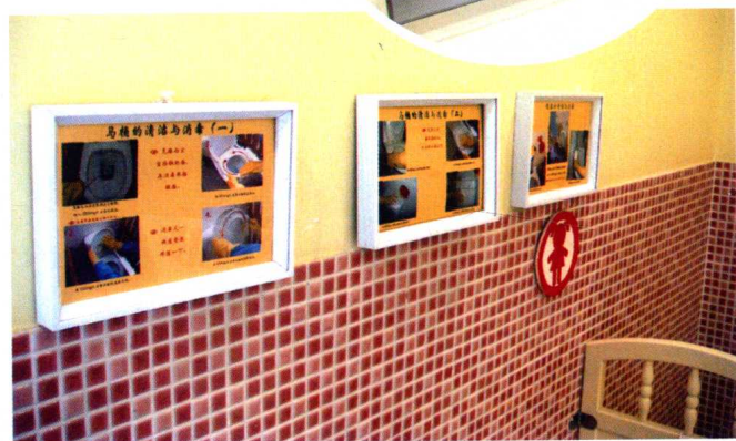
设立班级消毒公示台,让家长对幼儿园的保育工作高度信任。