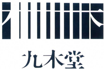
图1-3 作者 孙磊

字体设计课，是艺术设计院校非常重要的一门专业基础课程。如何用文字这一符号元素，表达思想、传递信息，同时要打破原有观念，追求创新，形成一套新的思维创作体系，是我们一直追求的目标。在文字的风格、潮流、审美表现等多方面不断地尝试，也是字体设计课的发展方向。