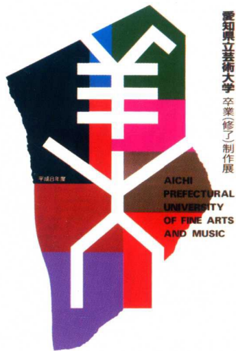
图1-6 作者 白木影