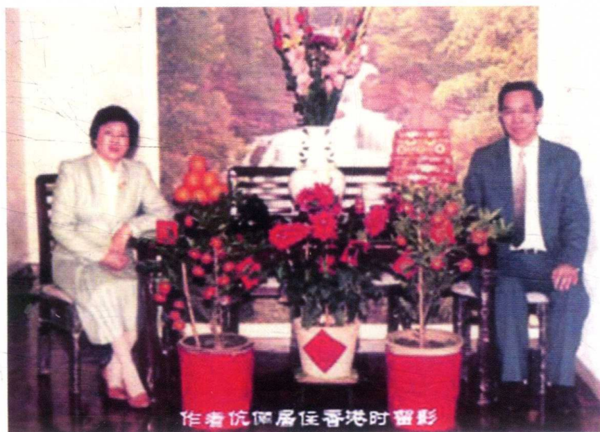
作者伉俪居住香港时留影