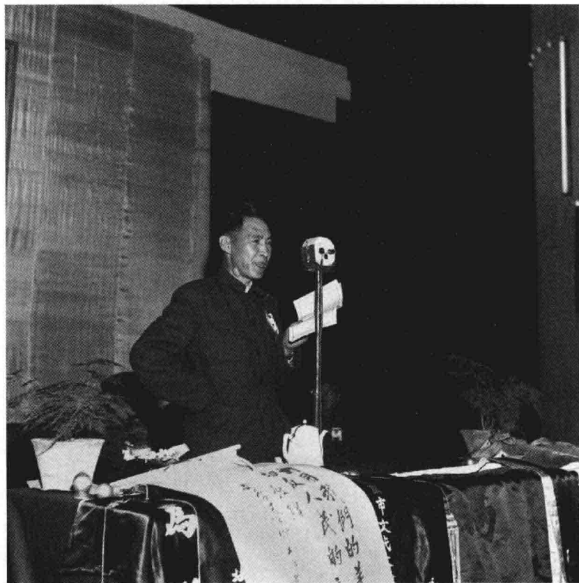
北京文学艺术工作者代表大会于1950年5月28日在劳动人民文化宫开幕。大会贯彻了“文艺普及第一”的方针，明确了要用文艺的力量动员和团结全中国人民的目标。图为赵树理在大会上讲话