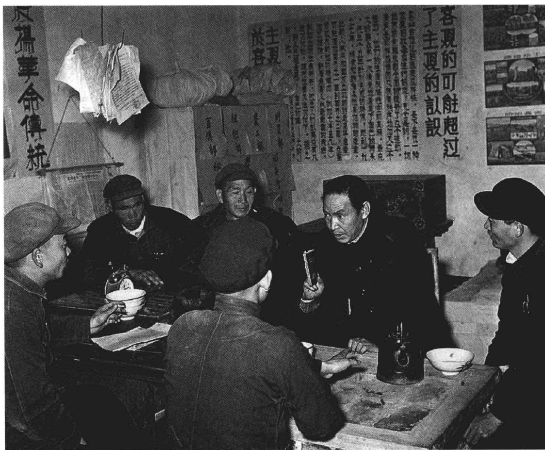
赵树理在他的故乡太行山区沁水县嘉丰乡农业社和社员们共同研究问题