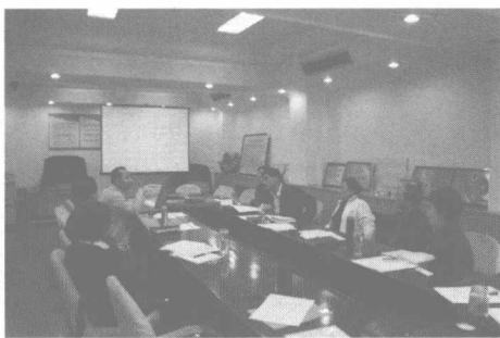
部务会专门研究部署信息化工作

通过几年的持续建设，东城区组织部在信息化工作方面实现了以“四化”激发新理念、促进新变化，主要体现在：一是信息网络化。目前，组织部内绝大部分非涉密信息的传输都可以摆脱书面、电话、口头等传统方式。利用网络等新技术所承载的信息数量、传输速度和精确性大大提高，成为组织部名副其实的信息高速公路。二是工作流程化。无论是具有监督反馈功能的内部信息收发还是各类办公资源管理，无不渗透着信息技术所强调的程序化思想，这将潜移默化地促使广大干部在研究工作时，积极优化工作流程，努力推动组织工作标准化。三是服务人性化。组织部门信息化工作本质上是通过提供有效服务提高组织工作效率。这种以人为本的本质要求促进组织工作不断精细化，以一种更加开放和人性化的姿态面对广大党员和干部。四是管理制度化。具有实操性的制度能够将系统与人有机关结合。因此，从初期调研、中期建设、后期维护再到突发事件应急响应，都强调了“制度、网管（网络管理员）、系统”三位一体，使信息化工作的开展、管理与维护初步实现了制度化。