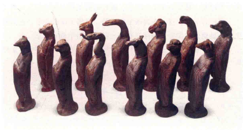
图 1-2 唐十二生肖俑 中国国家博物馆藏