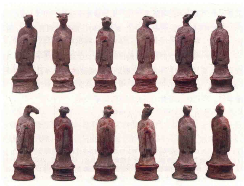
图 1-3 西安市郊出土十二生肖俑 陕西历史博物馆藏