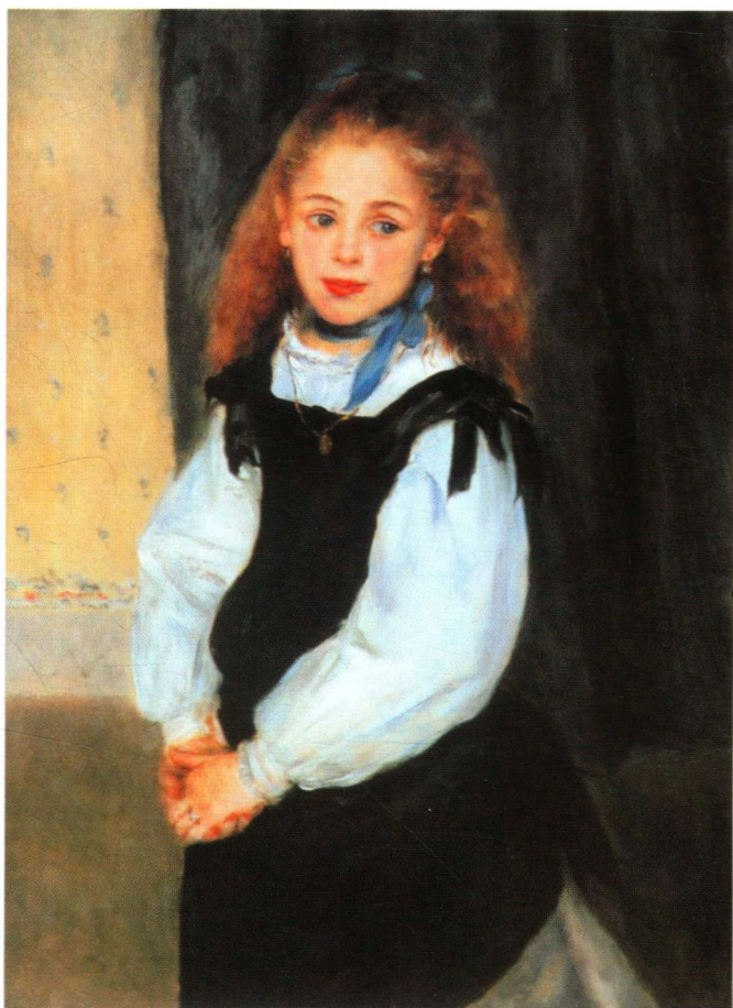
雷诺阿《鲁格郎女儿的肖像》 布面油画