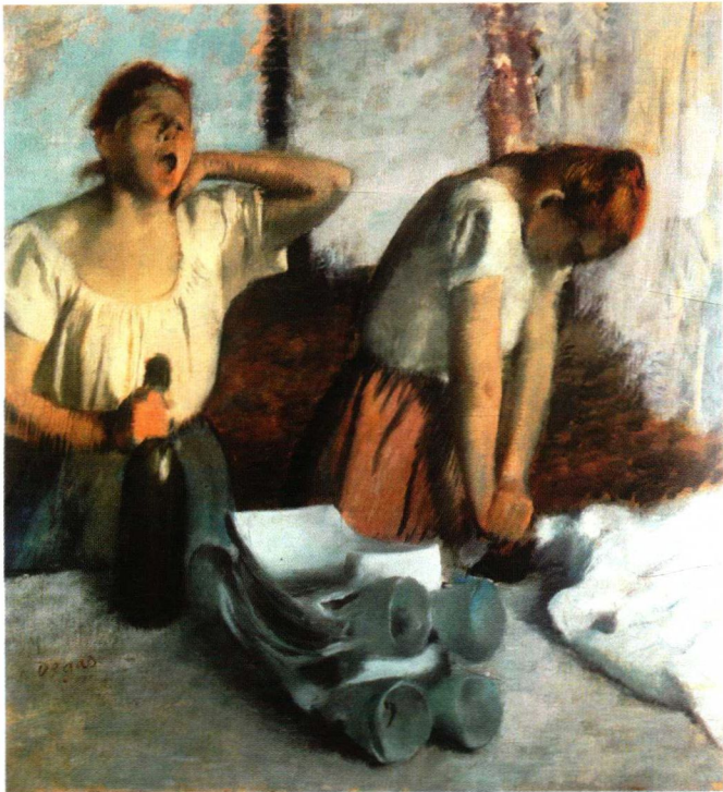
德加《洗衣女工》 色粉笔