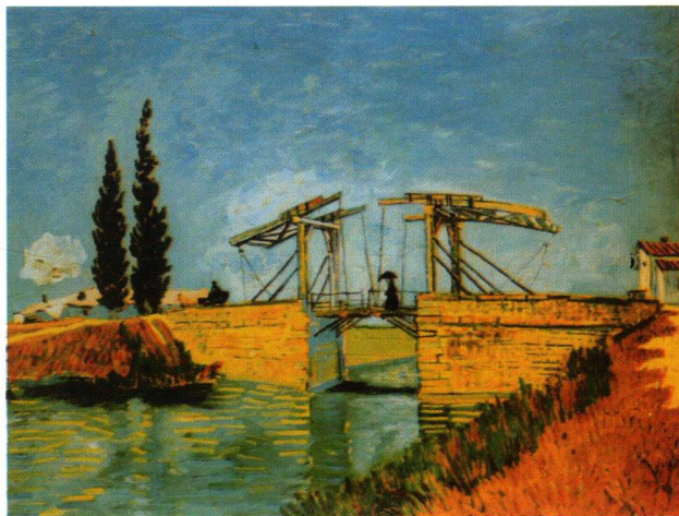
凡·高《朗卢瓦桥》 布面油画

对色彩的普遍兴趣，直到19世纪早期才产生。色彩理论也作为专门的学科成为艺术学习的重要内容。德拉克罗瓦、透纳、西涅克、凡·高、康定斯基等一些艺术家，也都相继发表了他们的理论学说，但是有很多画家更多的是靠直觉和经验去工作，应该说他们在实践中