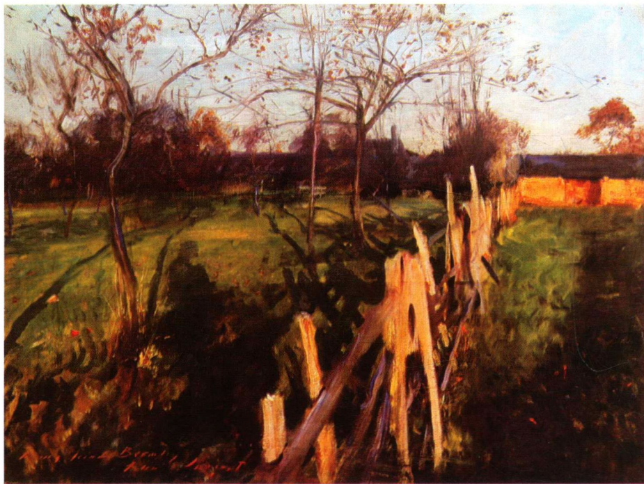
萨金特 《家园》 布面油画