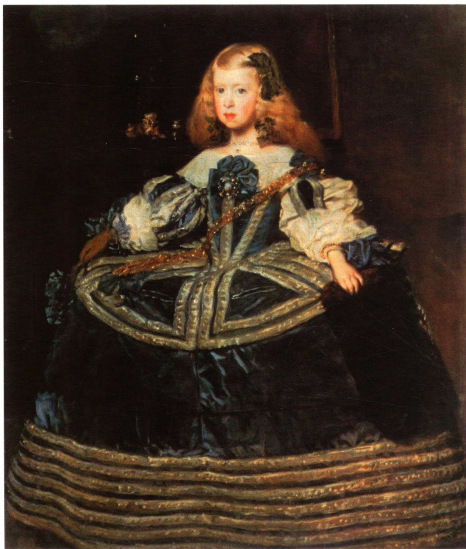
委拉斯贵兹 《8岁的玛格丽特公主》 布面油画