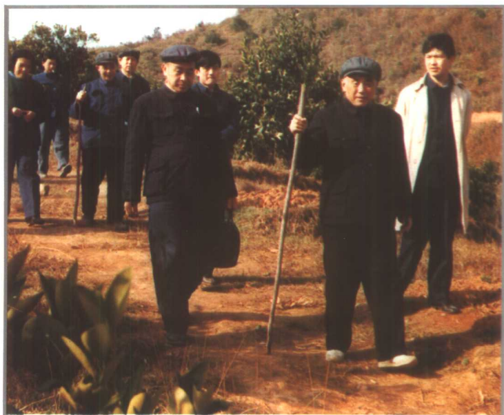
1982年，省长苏钢（右二）视察黔东南林区