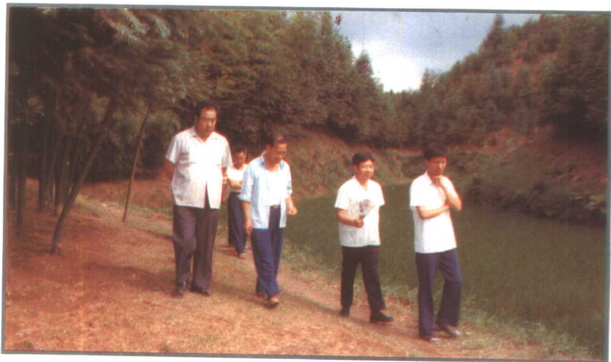
1984年，林业部副部长王殿文（左一）视察黔东南林区