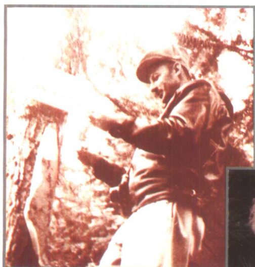
1958年苏联林业专家在锦屏县实地考察“八年杉”