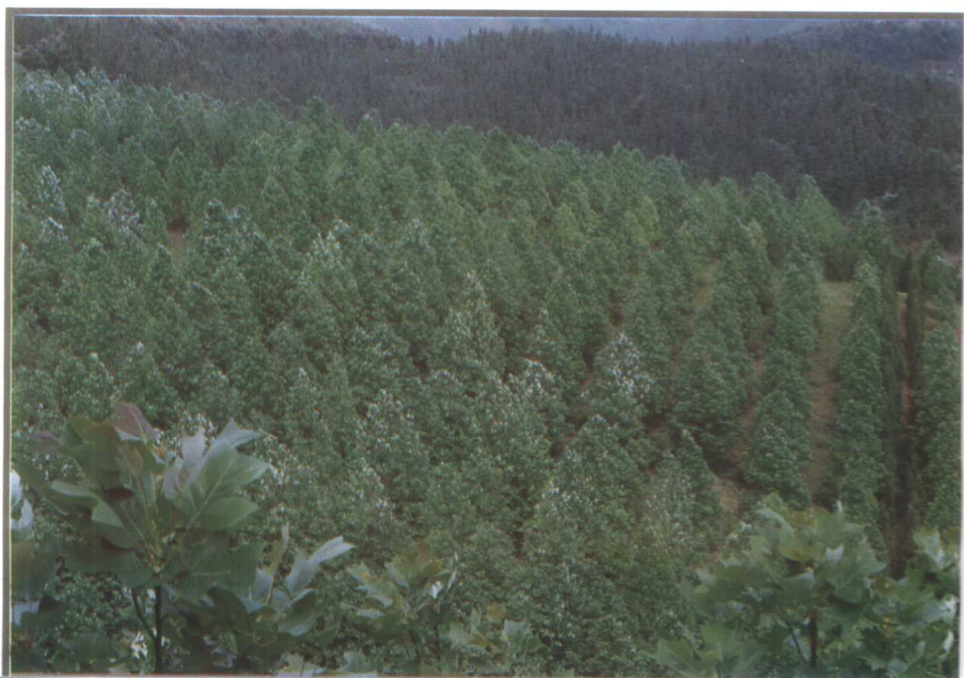
黎平东风林场鹅掌楸种子园