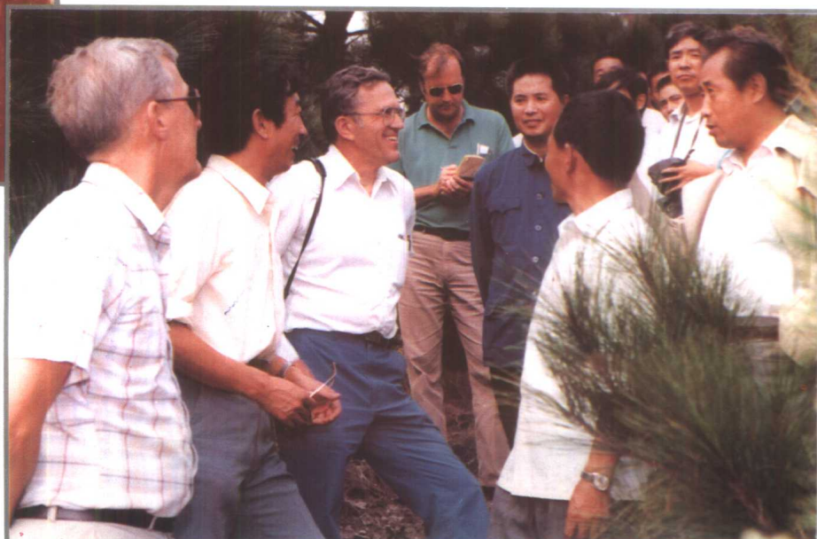
美国林业专家考察黄平马尾松种子园 ▼