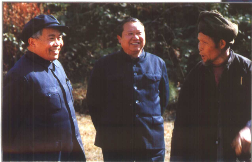
1987年，省长王朝文（右）在州长吴邦建陪同下视察黔东南林区