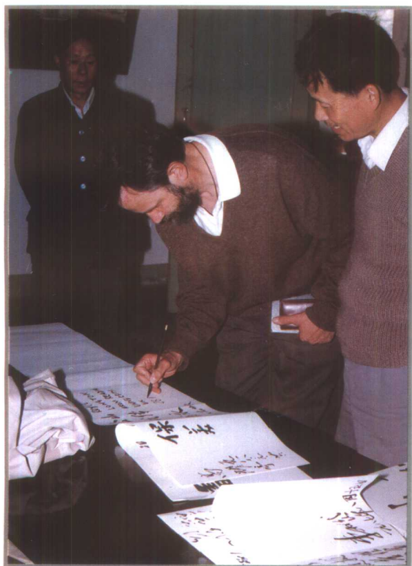
英国专家考察黔东南林区后题词