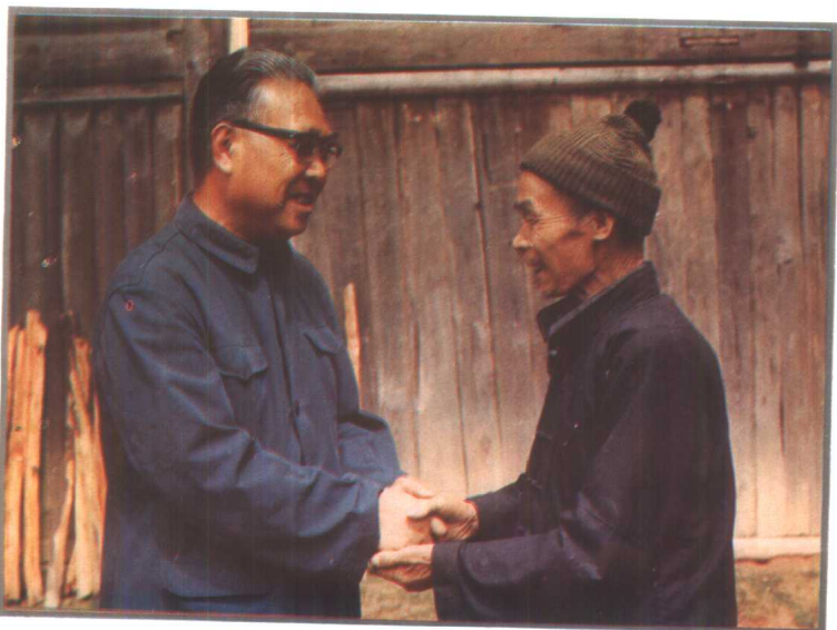
1981年元月，林业部副部长杨珏视察黔东南林区