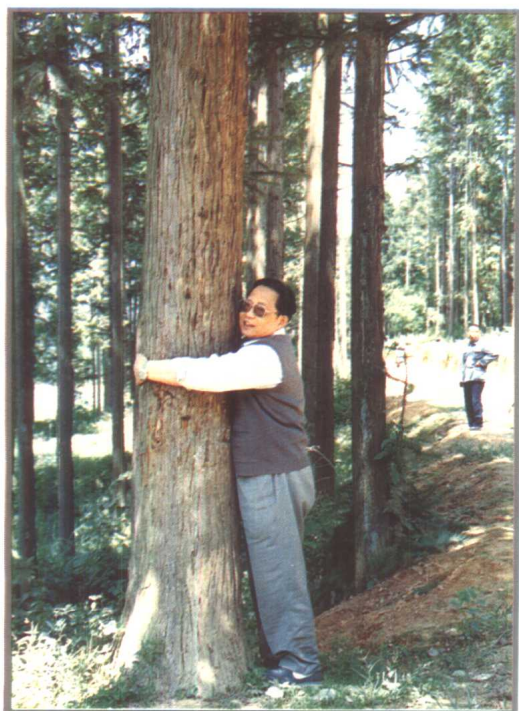
1989年，省委书记刘正威视察黔东南林区