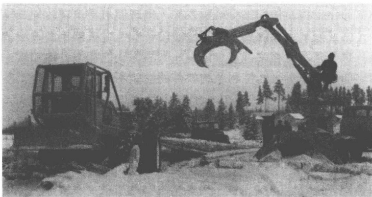
图 1-1 老式罗克莫林业机械

例如，图 1-1 显示了一辆老式起重机在往卡车上装载木材。照片中原始的集材机已经将砍伐的木头从站台拖到装载区。现代传送机可以用吊杆将木材转移到货车上，然后再把它们转移到路边。由于不拖动木材，受到地面的磨损较小，在站台上便可将木材切割为希望的长度。当然，伐木工人也可以用电锯来完成这项工作，但现代收割机可以自动切割，只需要按几个按钮就可以将直立着的树木切割成精准长度的木材。