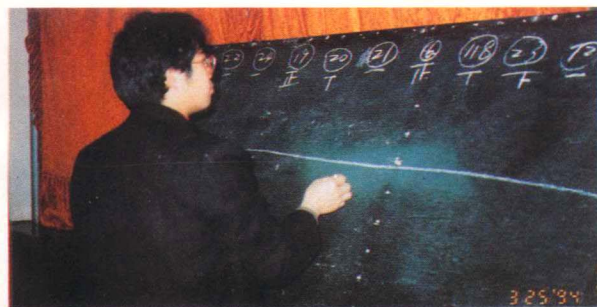
工作人员在统计选票

1994年3月21日至25日，贵州省农村金融学会第二届优秀科研成果评奖工作在省分行花溪干训中心进行。