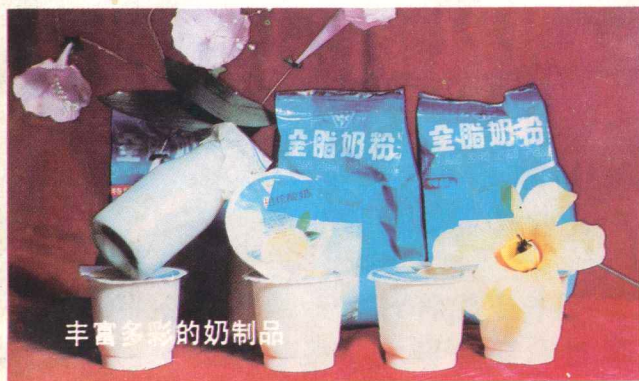
丰富多彩的奶制品