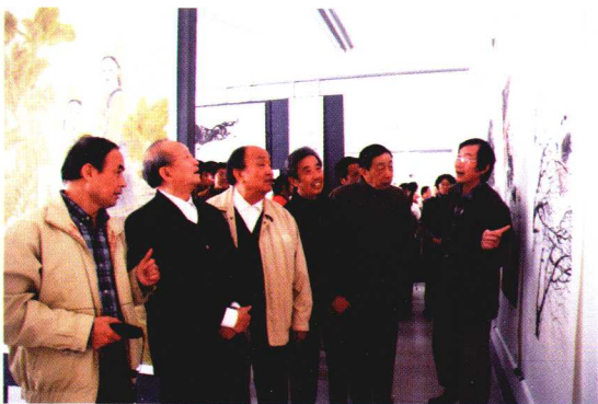
美术学院老领导、老教师参观画展