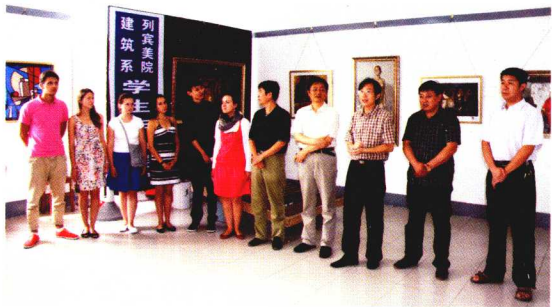
列宾美术学院来泰山美术学院进行学术作品交流