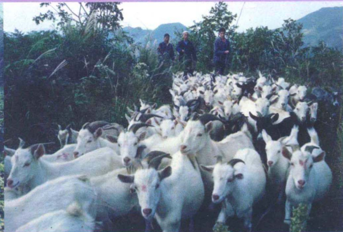
△小关乡金竹杠茶场饲养的山羊