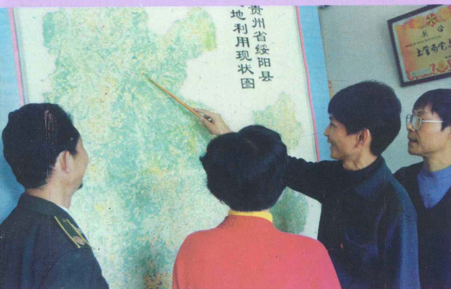
△绥阳县土管局干部在研讨全县土地利用情况