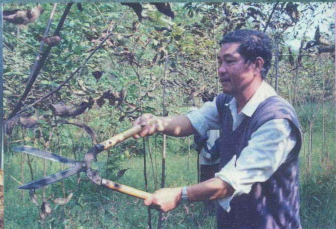
△小关乡金竹杠茶场开发的五倍子种植场