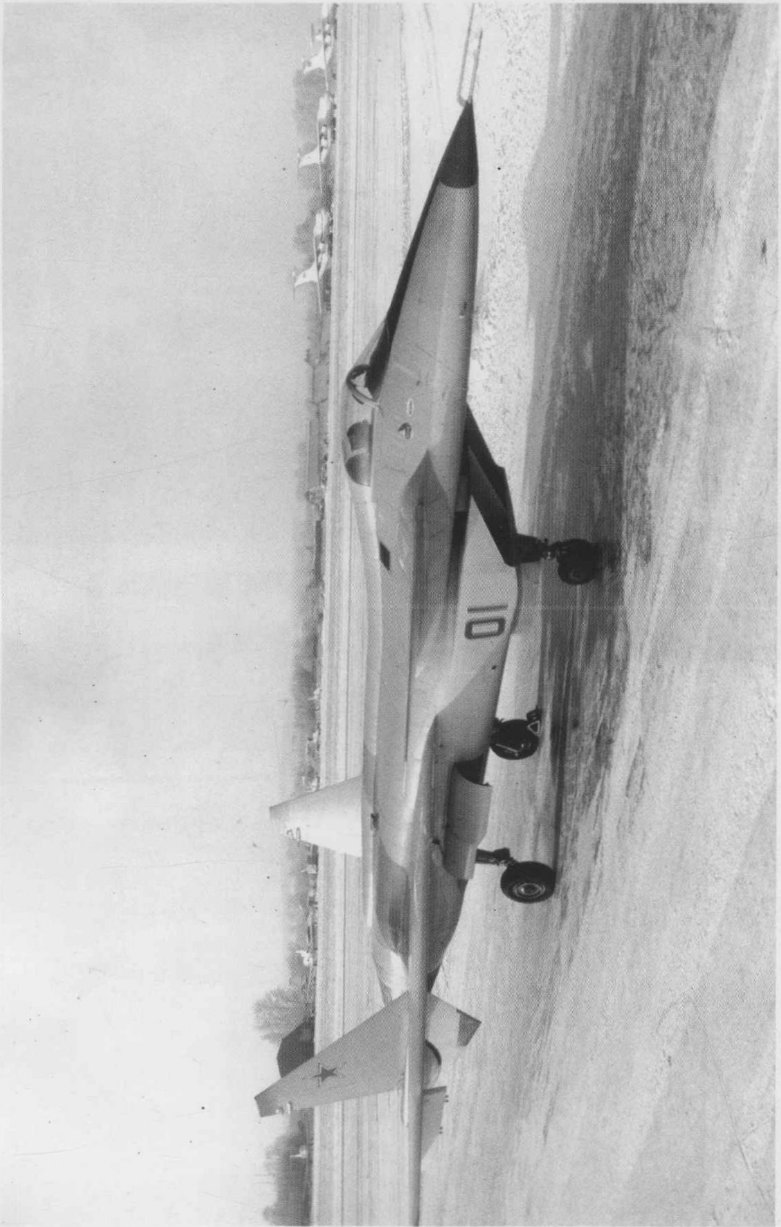
俄罗斯米格 I.44 隐身战斗机