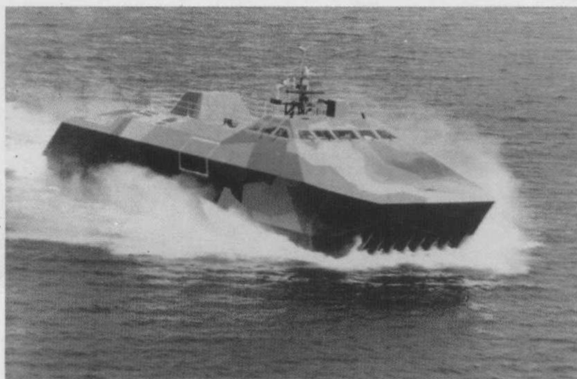
△ 瑞典“斯迈杰”号隐身船