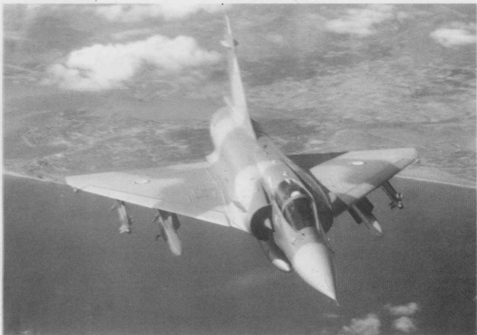
△ 法国幻影 2000 战斗机涂有海、陆、天一体伪装色