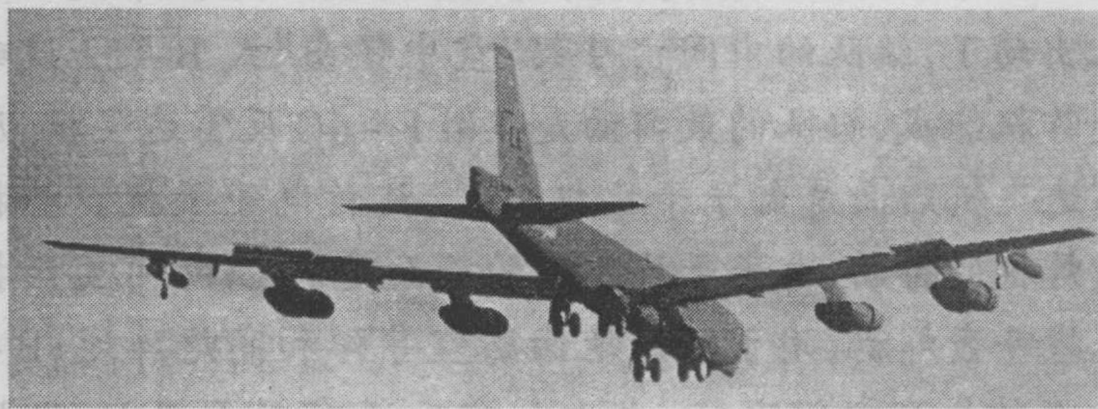
美国 B-52 型战略轰炸机

B-52飞机有49.05米长,翼展56.4米。飞机总重量达220多吨,它一次可载炸弹27吨。如果选用227千克的炸弹最多可挂66枚,打开弹舱后可一次投出,地面散布面积达1平方千米,平均25~100米落下一枚炸弹。难怪给它起的绰号叫“空中堡垒”。就是这样一个庞然大物,在这次才十几天的战役中,一连就有10余架被打了下来,实在令美国人痛心。虽然这与其在整个越南战争期间损失4000多架飞机相比是个小数目,但B-52战略轰炸机一次战役内竟然损失这么大,还真没有过。这也说明越南北方的地对空导弹对美国飞机威胁太大了。