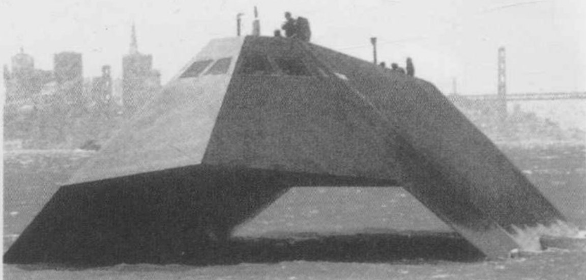
△ 美国“海影”号隐身舰