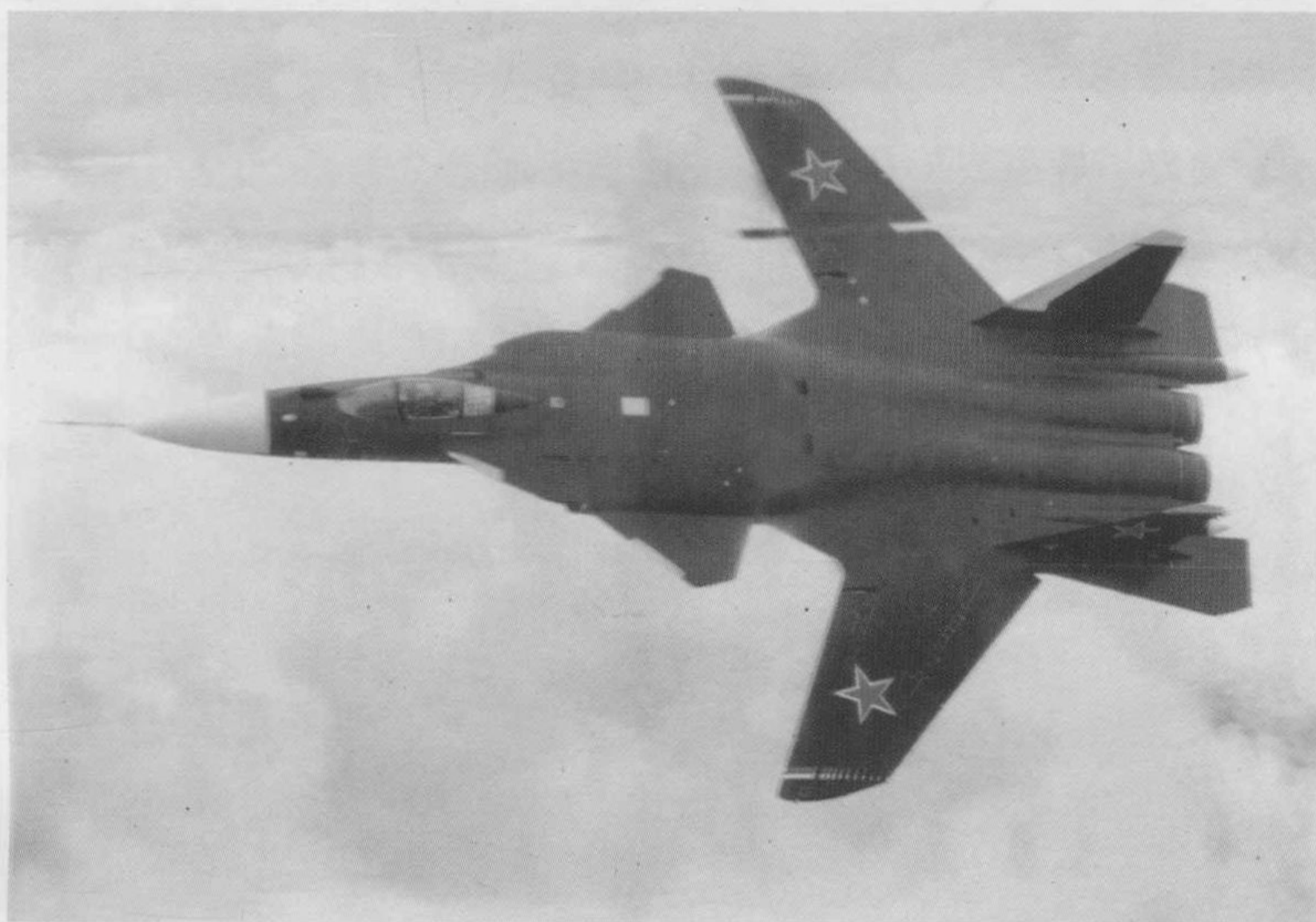
▽ 俄罗斯 S-37 隐身战斗机