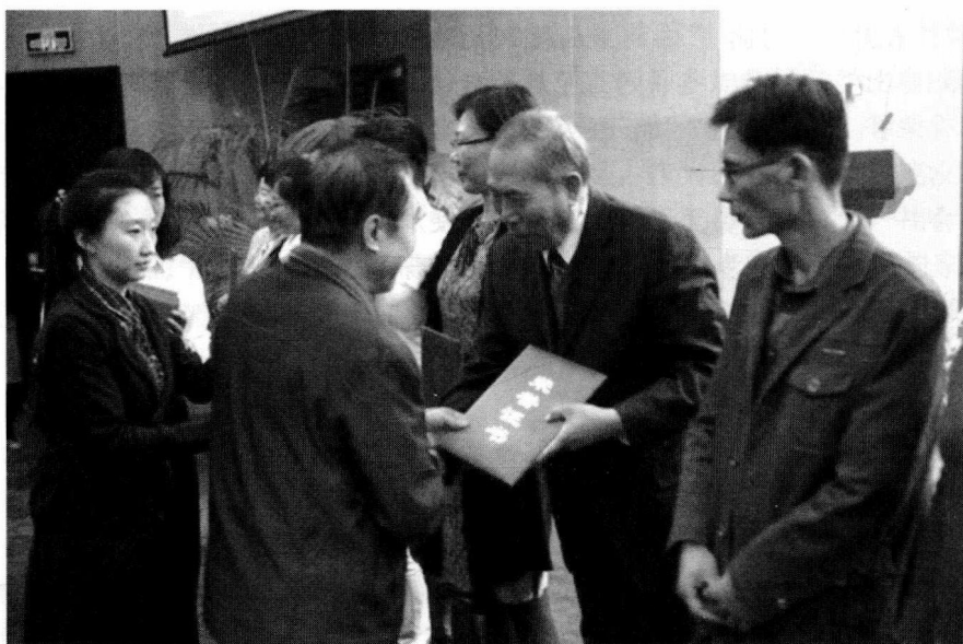
2015年10月10日在北京市教委会议厅接受表彰证书照