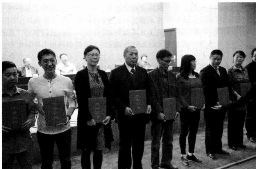
2015年10月10日在北京市教委会议厅接受表彰集体照