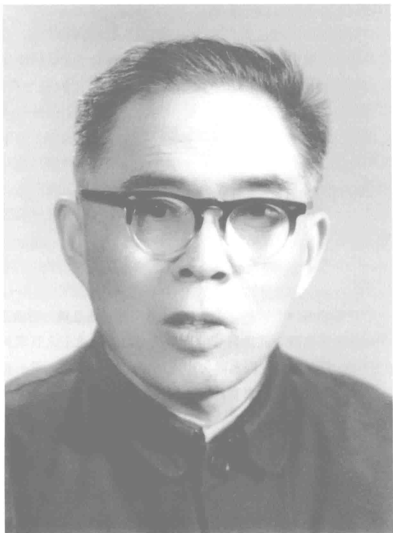
刘 冰 (1921年—2017年)