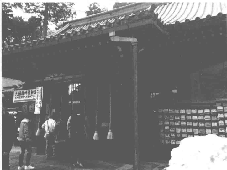
◎ 箱根神社（旧箱根权现）的拜殿。

早川庄还有一部分土地则归土肥实平之子远平（弥太郎）管理，以早川（小早川）氏为苗字。不过，和田合战（1213年，建历三年）的时候，小早川远平之