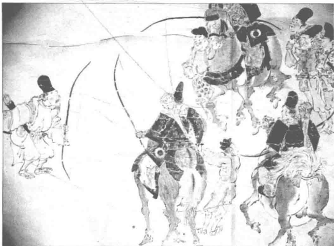
日本武士早期以骑射作为主要作战手段。

进入公元7世纪，神奈川县地区开始出现一些行政区划的雏形，例如相武（又称佐贺牟，さがむ，sagamu）、师长（又称矶长，しなが，shinaga）国造以及镰仓别之国。师长国大致位于足柄平原一带，相武国大致在相模川流域一带，镰仓别之国则位于镰仓一带。大化改新之后，日本国一级的行政区划逐渐定型，国以下设“评”，评下设“五十户”。师长国与镰仓别之国并入相武国，さがむ发