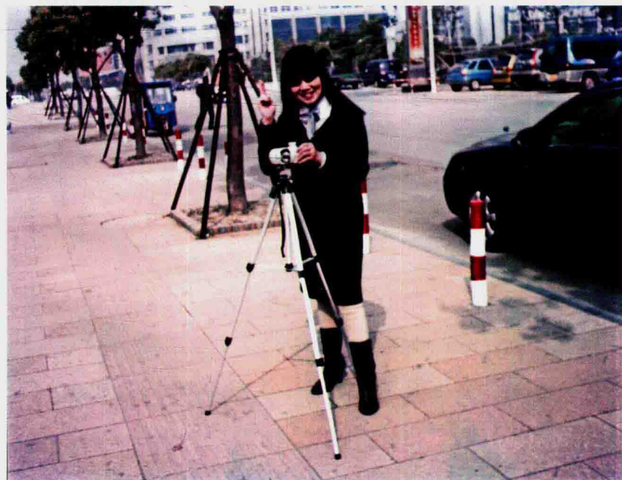
2009年秋季作者在椒江水晶公园摄影