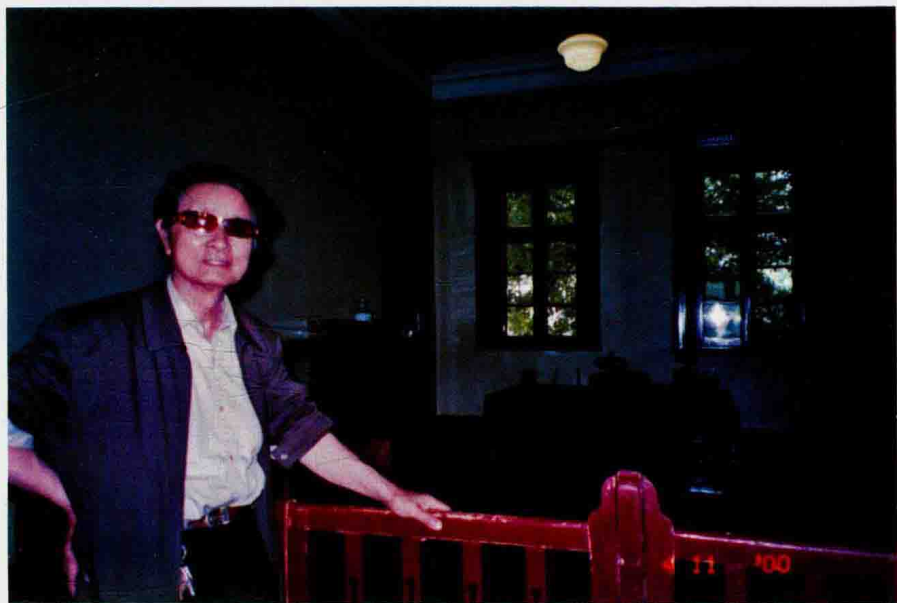
2016年秋季, 作者爱人(顾问)在南京总统府留影