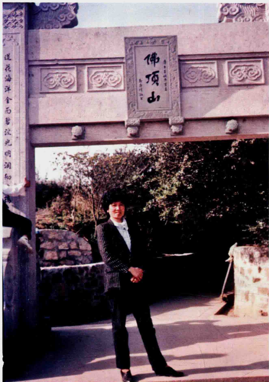
2007年五一作者在普陀山游览