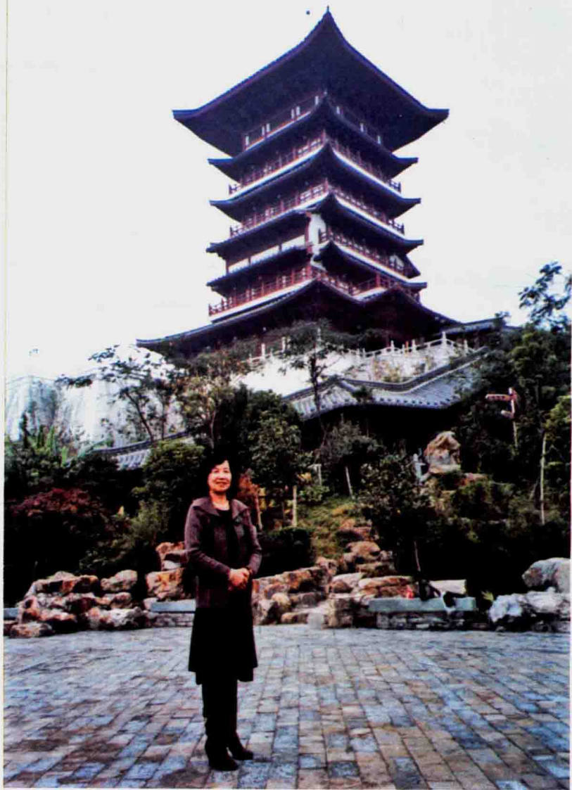
2012年晚秋作者在椒江白云阁留影