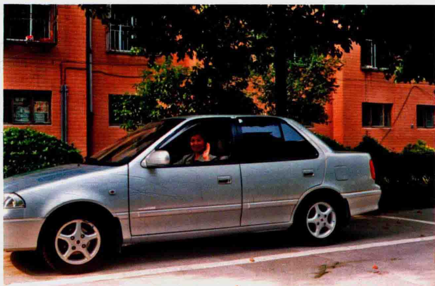
2003年春天作者在椒江云健小区车辆起步。