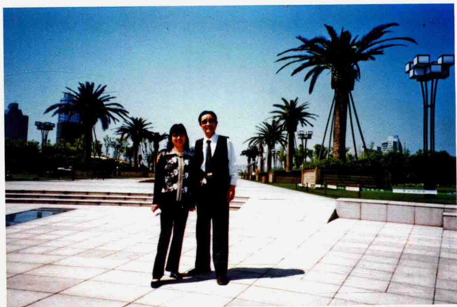
2009年春天作者与爱人（顾问）在椒江市民广场游览。