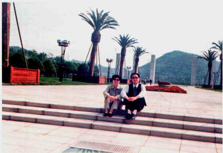
2006年春天作者与爱人（顾问）在椒江市民广场观赏自然风光