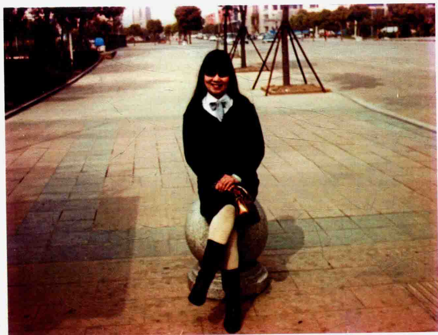
2009年秋季作者在椒江水晶公园留影