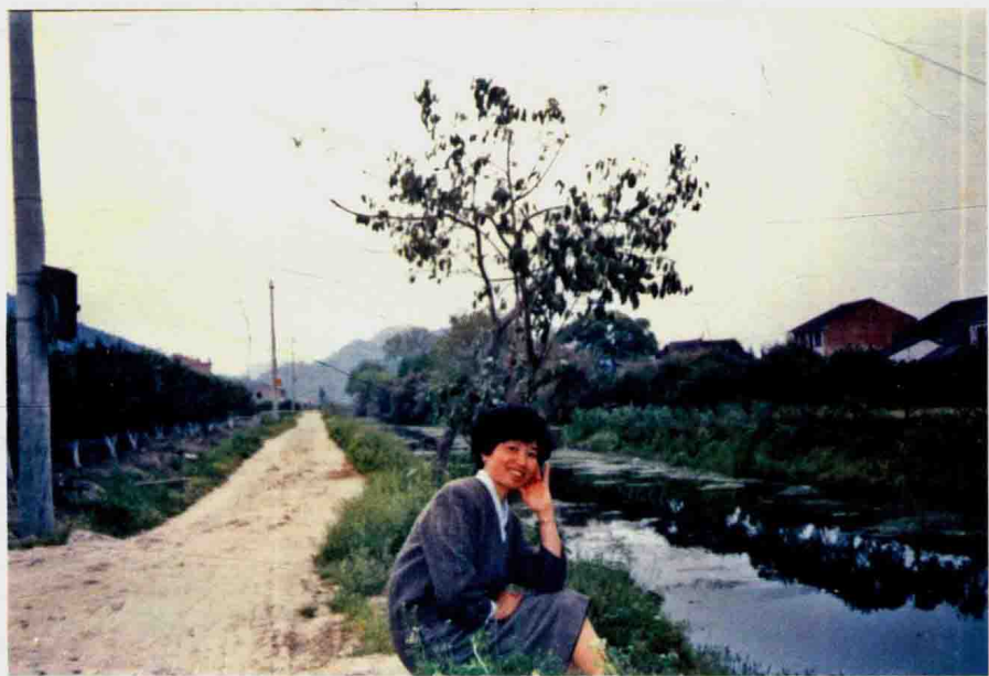
2007年晚春作者在河边小憩欣赏自然美景