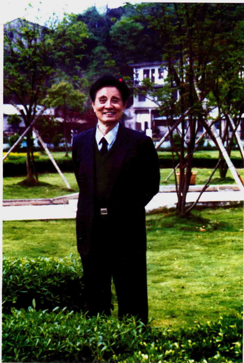
2013年春季作者爱人（顾问）在椒江凤凰公园留影