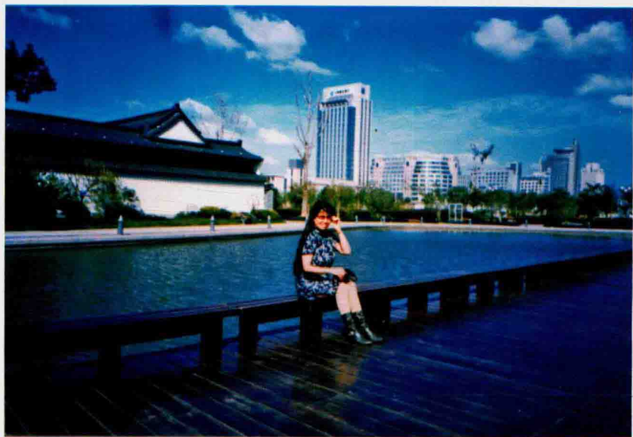
2005年夏季作者在椒江水晶公园留影