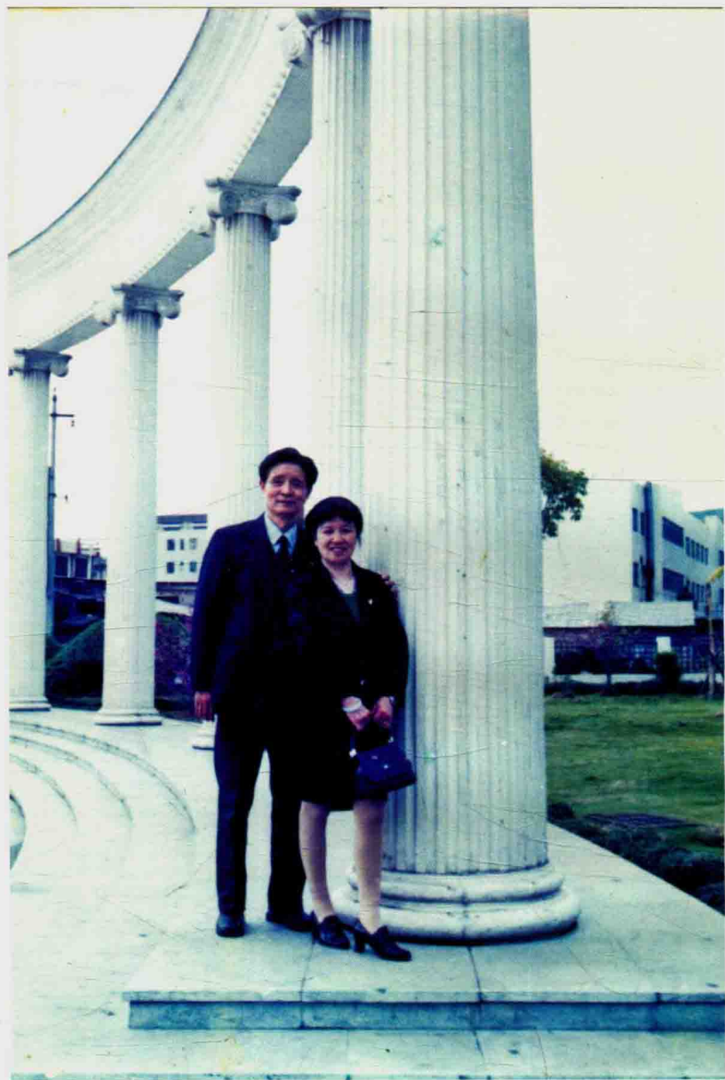
2013年春天作者与爱人(顾问)在椒江凤凰公园留影