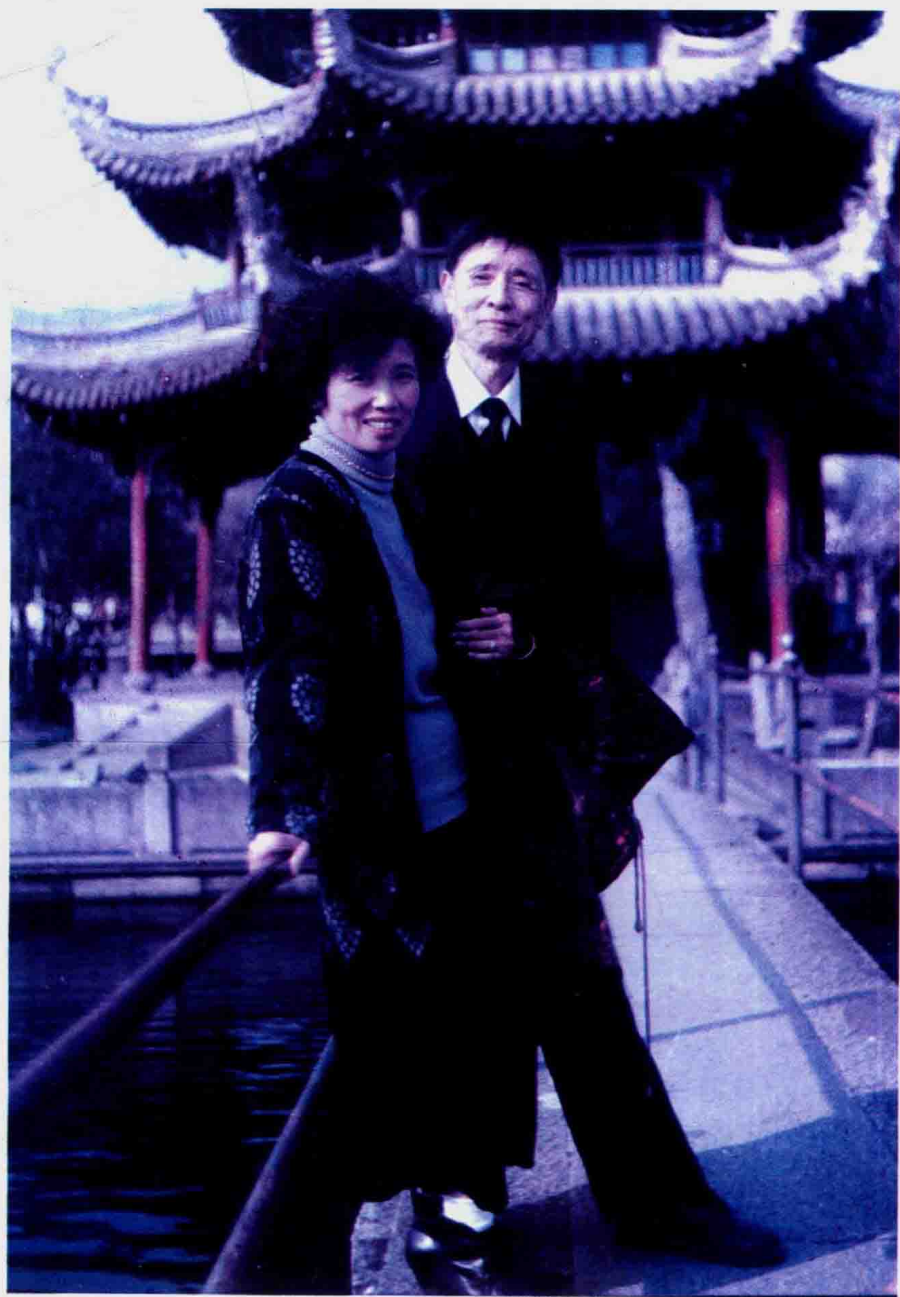
作者与爱人（顾问）摄于2008年新春佳节