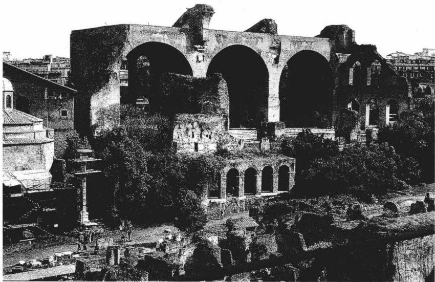
古罗马的马克森提巴西利卡遗迹（砖拱结构）（约公元307—312年）

人与房屋建筑的特殊关系还可多说几句。房屋建筑与人身和人的活动密切相关、接触紧密，还与人心相通。在满足人的实用需求的同时，又将人的相当一部分心理、心思、情感、喜好、记忆和信仰固化于其中。在过去流动性很低的时代，人长时间待在一处房屋中，生于斯、长于斯、终老于斯，长期被所住的房屋包容，数十年厮守，几乎融为一体。“家”的概念与住屋紧密关联。大家对自己住过的房屋，长期待过的建筑，尤其是自家的祖屋、出生和小时候住过的房舍，以及心仪的名人的故居，常会怀有很深的感情，生发许多的怀念。