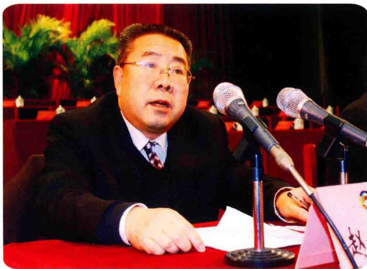
区政协主席赵汝荣