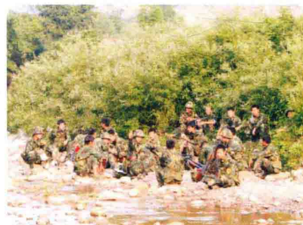
“再现神奇转折”军事演练