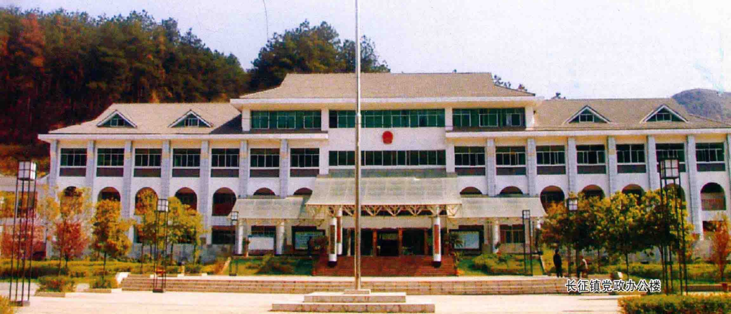
长征镇党政办公楼