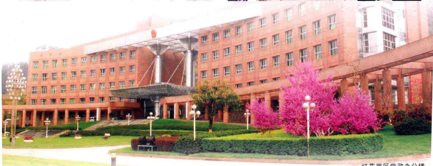
红花岗区党政办公楼