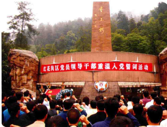
红花岗区干部重温入党誓词活动