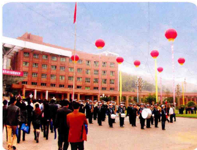
中共遵义市红花岗区第二届第二次代表大会