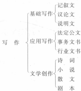
图 1-1 写作的分类