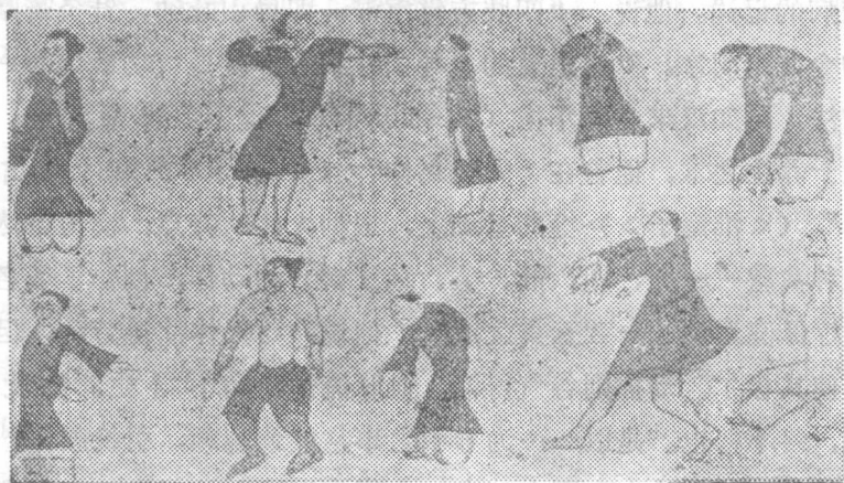
图 2 西汉以前的导引图

1973年，从湖南长沙马王堆三号汉墓（公元前168年）出土的文物中，发现了西汉（公元前206～公元25年）初期保存下来的帛书《却谷食气篇》和帛画《导引图》 ② 。前者的内容是“导引行气”法，后者是44幅彩绘“导引图”，图中绘有人模仿狼、猴、猿、熊、鹤、鹞运动的图象。这个重要的发现，说明我国至晚在西汉初期就已经用彩色图谱的形式来传授气功（导引行气）了。