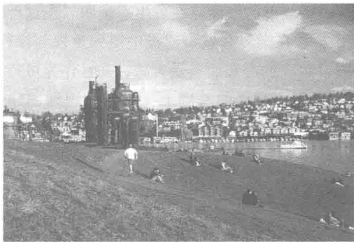
图 1-1 改造后的西雅图煤气厂公园

的研究积攒了丰富的经验。事实上，这些工业废弃景观中的场地、工业建筑和构筑物，以及相关元素不仅有其珍贵的历史价值可以挖掘研究，而且还具有显著的更新利用的现实价值。于是，在20世纪90年代中后期以来，国内很多城市，特别是一些经济发达的大城市，都出现了保护和再利用工业遗存的实践，如具有历史意义的广东粤中造船厂、见证南京近代工业化进程的金陵制造局、广州市五仙门发电厂、北京798工厂、上海钢铁十厂以及记载上海百年工业兴衰的苏州河沿岸工业遗存的改造实践等。