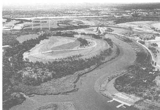
图 1-4 港口岛公园