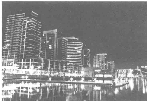
图 1-2 伦敦的 Dockland