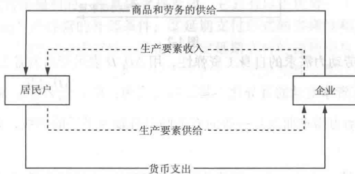
图 1-1 收入循环模型

【解析】如图1-1所示,收入循环模型根据经济学的基本理论揭示劳动力市场的基本功能。