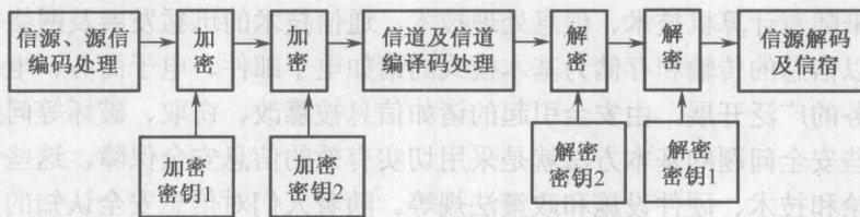
图 1-1 通信系统的结构模型

通信系统实现了信息的传输和存储等处理功能，在这个体系中，还有用来提升系统安全性能的安全处理，以突出安全处理为特点的基本模型如图 1-1 所示。