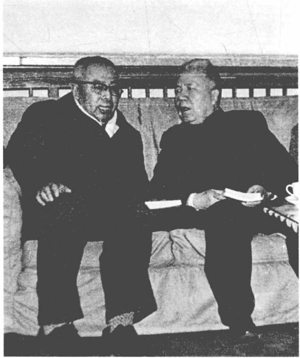
一九八一年， 玛拉沁夫与 周扬在北京