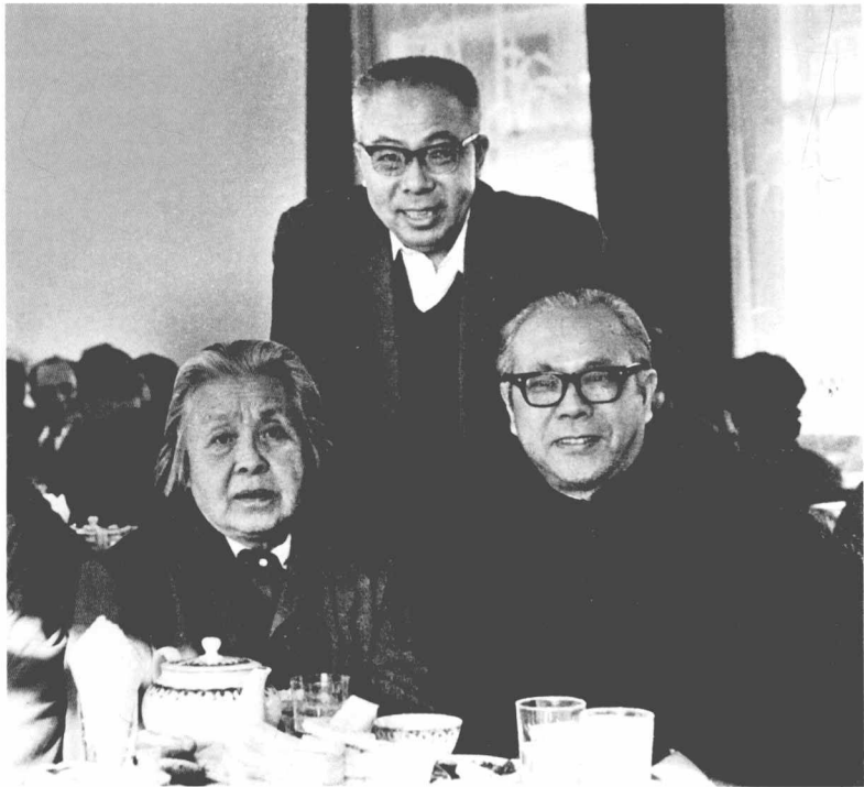
一九八六年，玛拉沁夫与丁玲（左）、周而复（右）在北京