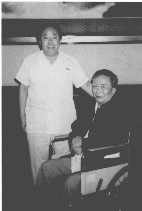
一九八一年八月， 玛拉沁夫与艾青