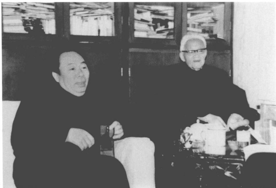
玛拉沁夫与巴金在上海