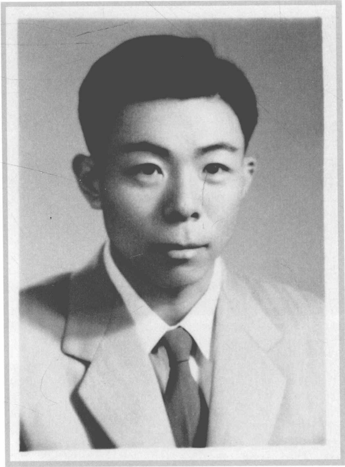
一九五八年十月，玛拉沁夫出席亚非作家会议的护照像