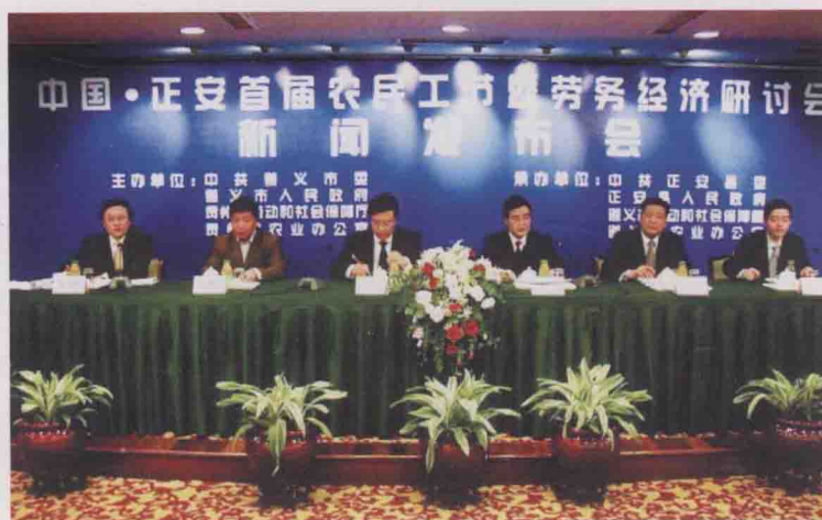
2007年5月，中国·正安首届农民工节暨劳务经济研讨会。