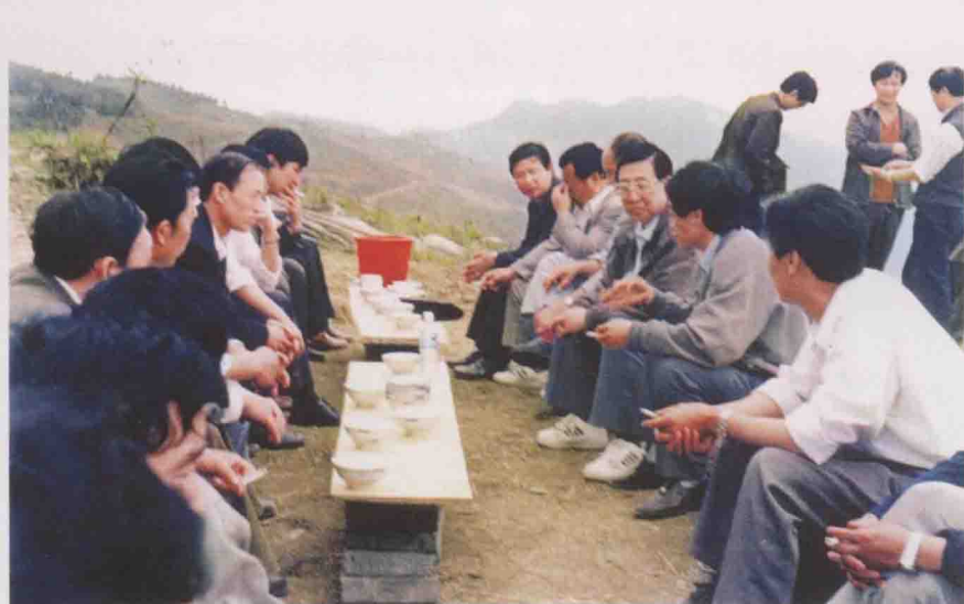
1996年，省政协主席龙志毅（右三） 在务川自治县丰乐镇乌龙山考察。