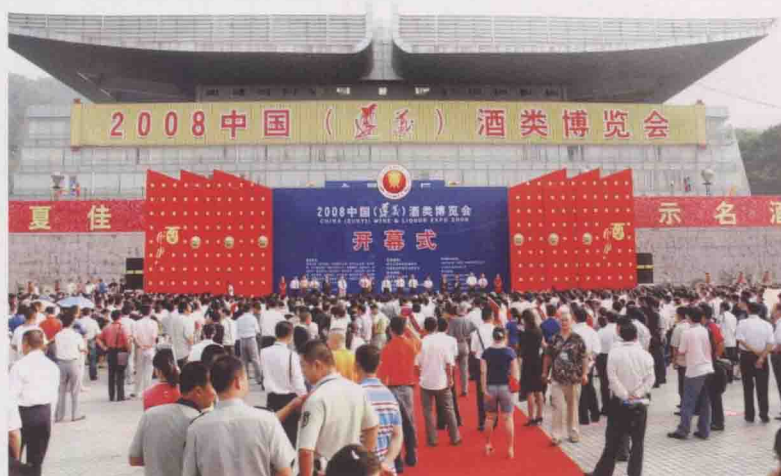
2008年9月19日，“2008中国（遵义）酒类博览会”开幕式。