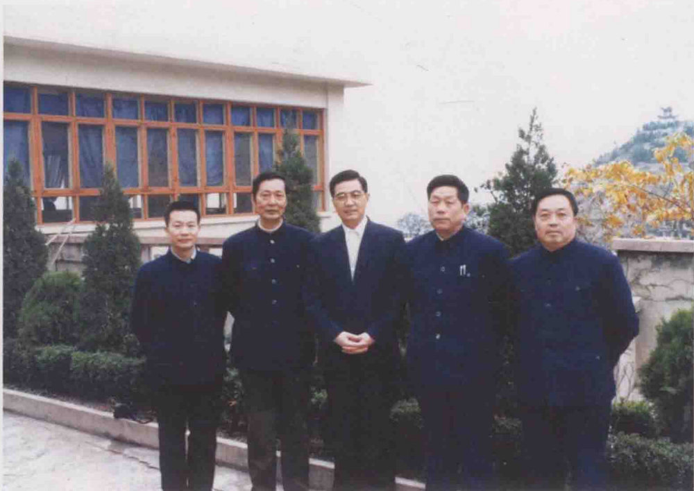
1988年，时任中共贵州省委书记的胡锦涛同志（中）与在贵阳参加全省农村工作会议的遵义地区党政领导合影。