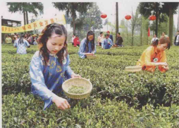
2007年3月31日，凤冈县举办中国西部茶海“遵义首届春茶开采节”。此为永安镇田坝村姑娘们开采新茶。