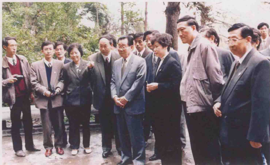
1994年，全国政协主席李瑞环（右四）参观红军烈士陵园，省、地党政领导陪同。