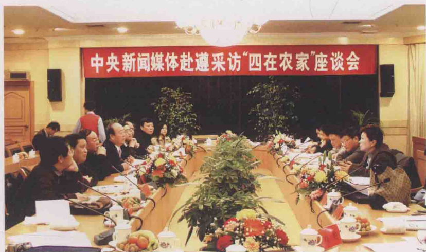
2006年，中央新闻媒体赴遵义采访“四在农家”座谈会。