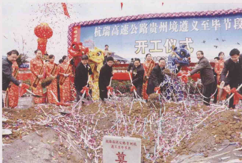
2008年12月28日，杭州至瑞丽高速公路贵州境遵义至毕节段开工奠基仪式。