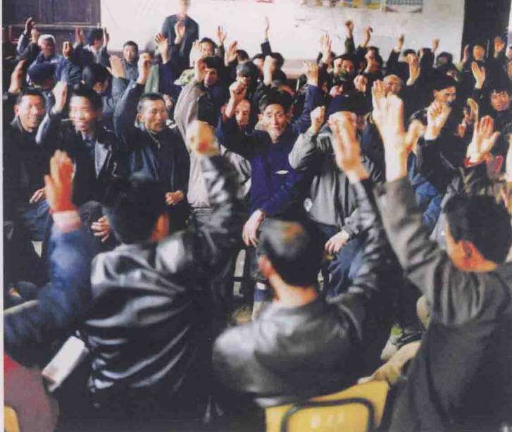
2004年12月，余庆县大乌江镇凉风村“海选”村党支部书记。此为村民们举手通过选举办法。