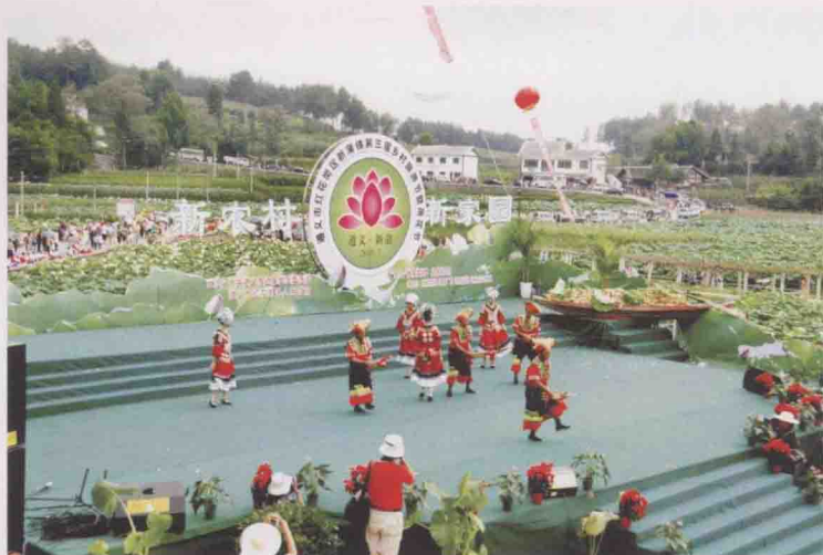
2008年7月，红花岗区新蒲镇第三届乡村旅游节暨荷花节。