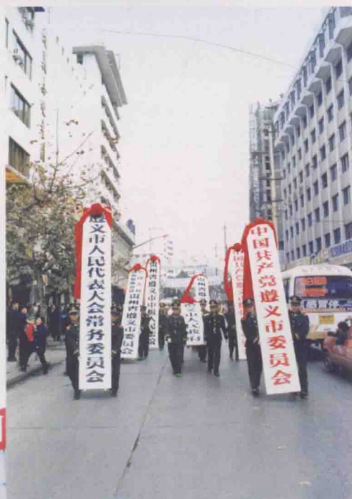
1997年12月， 遵义撤地设市。