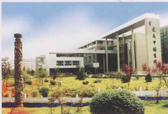
新建成的遵义市图书馆投入使用。