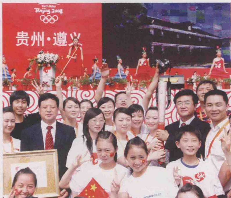
2008年6月，北京奥运火炬传递到遵义。