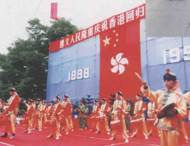
1997年，遵义人民 庆祝香港回归。