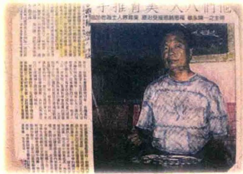
一張用盡氣息搜尋的剪報，一抹無法遺忘的勉強微笑， 永生永世放於心底的記憶——紀念父親逝世十二周年。 (1999/12/01 中國時報)