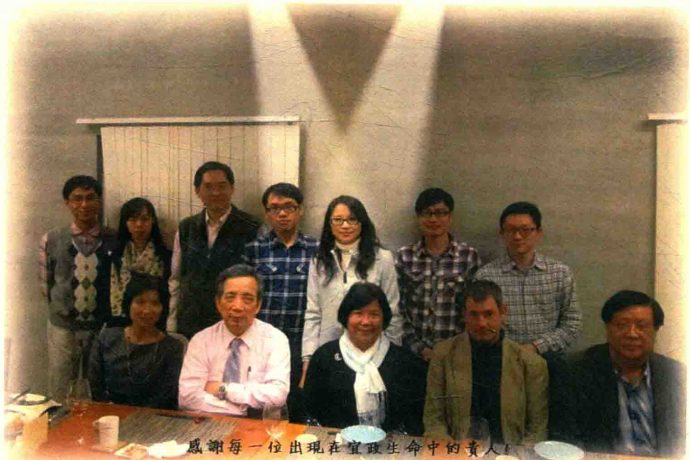
感謝每一位出現在宜政生命中的貴人！ 後邊的磚牆好似一幅水墨，整個畫面因為有您們的參與，產生奪目的光彩。 2014/01/17