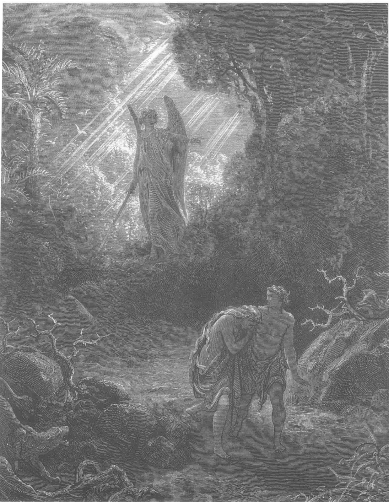
亚当、夏娃被逐出伊甸园