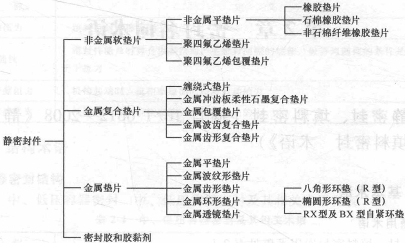
图 1-1 静密封件的分类