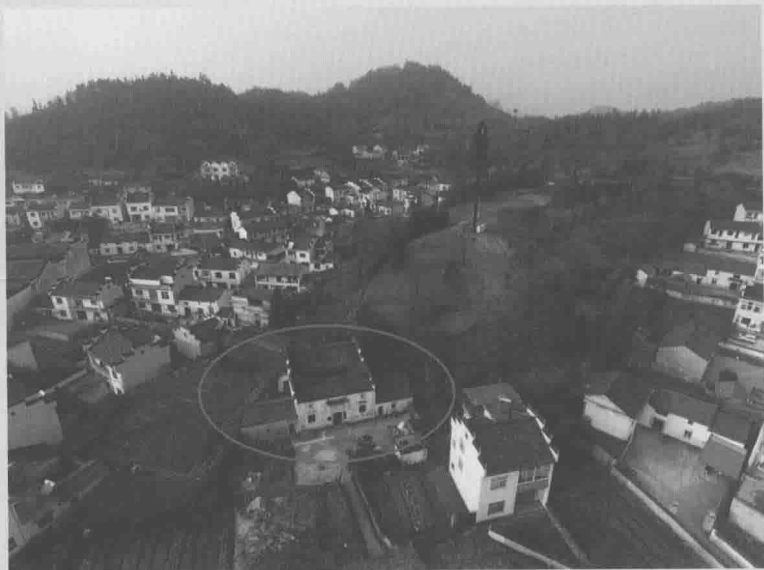
江泽涵故居的航拍照片（摄于2017年）

1902年10月6日，江泽涵出生于安徽省旌德县江村。江村位于皖南山区黄山脚下，风景秀丽。