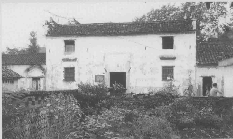
江泽涵故居（摄于2004年）

1902年10月6日，江泽涵出生于安徽省旌德县江村。江村位于皖南山区黄山脚下，风景秀丽。