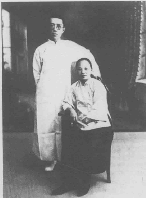
胡适与江冬秀合影

1917年12月，美国留学回来的胡适与江冬秀完婚。次年6月，江冬秀来北平定居，先住南池子缎库后胡同8号，后来迁至北河沿钟鼓寺14号。