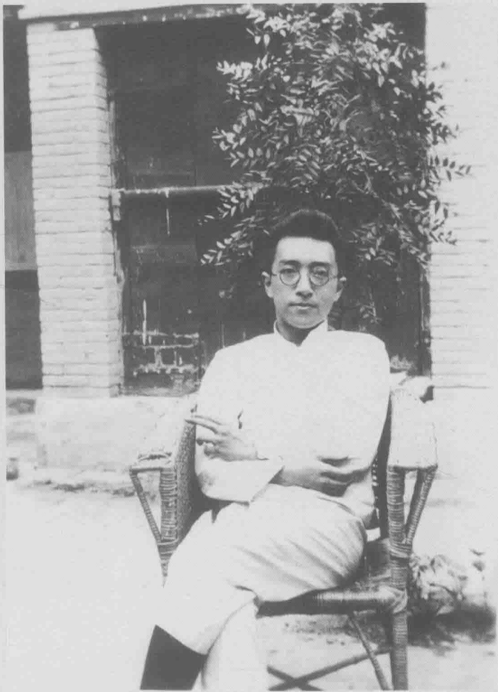
1924年，胡适在北京钟鼓寺14号住宅的院子里

1918年11月，因母亲逝世，胡适归乡奔丧。次年1月，胡适返回北平，把江泽涵带到北平住在自己家中。江泽涵准备投考学校。