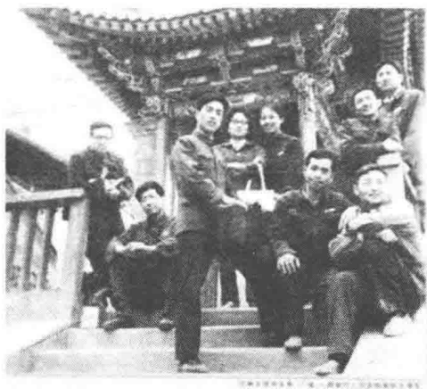
作者上大学时与同学合影