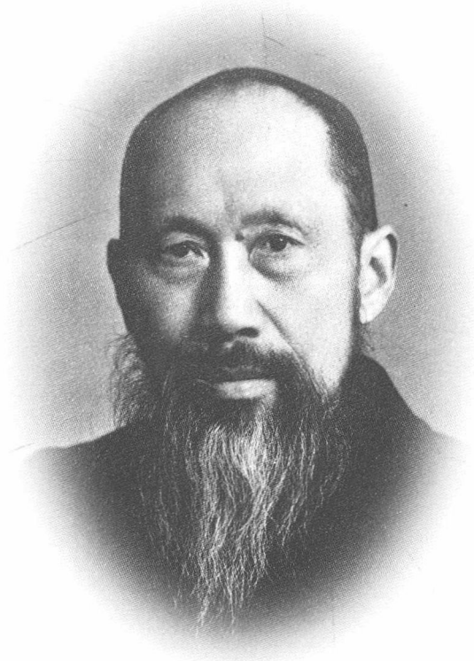
张澜 ( 1872—1955 )

曾任中华人民共和国中央人民政府副主席， 全国人大常委会副委员长，全国政协副主席，民盟中央主席