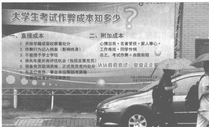
图 1.2 宁波工程学院考试作弊成本海报