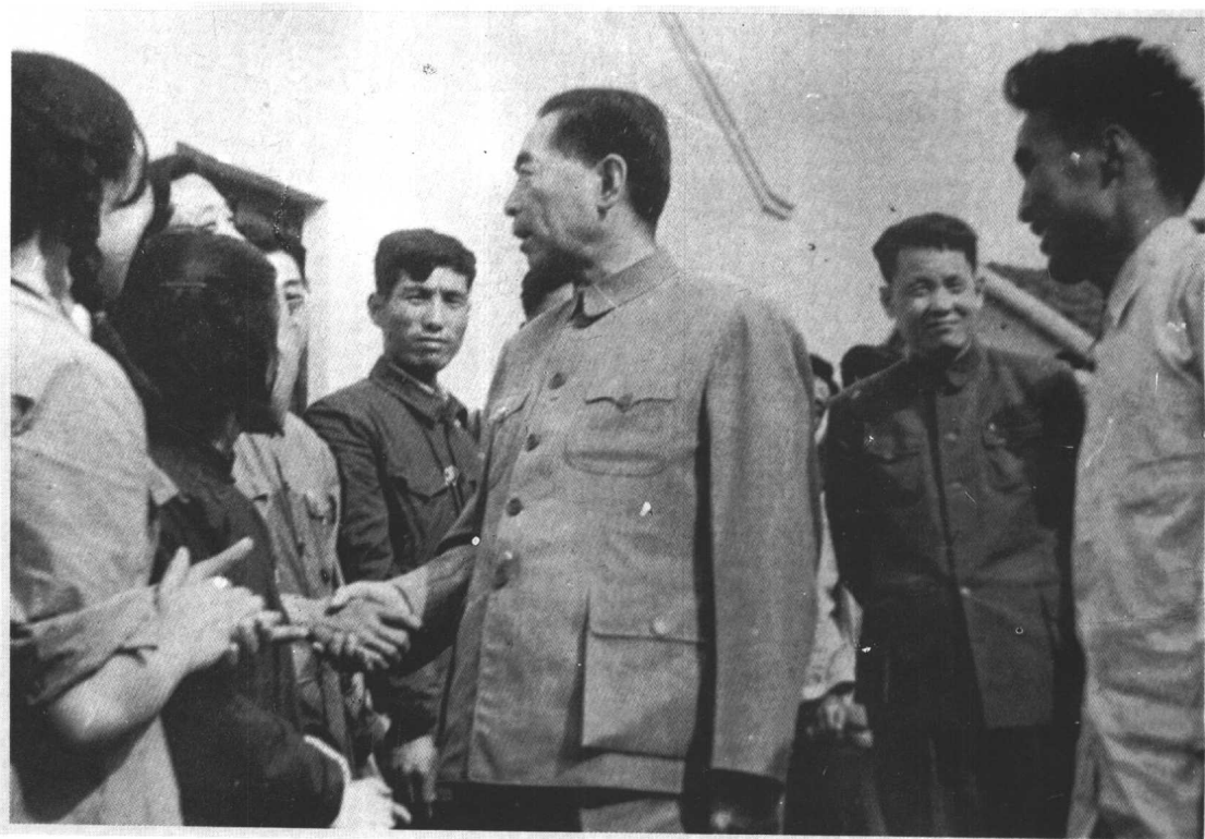
1960年5月国务院总理周恩来在贵阳亲切接见民兵代表。