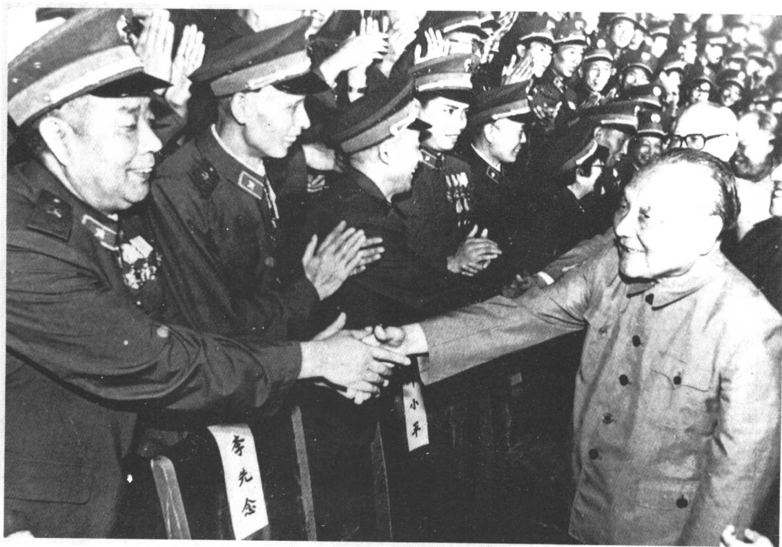
1987年7月，中央军委主席邓小平接见全军英模代表大会代表时与凯里军分区副司令员吴兴春（左一）亲切握手。