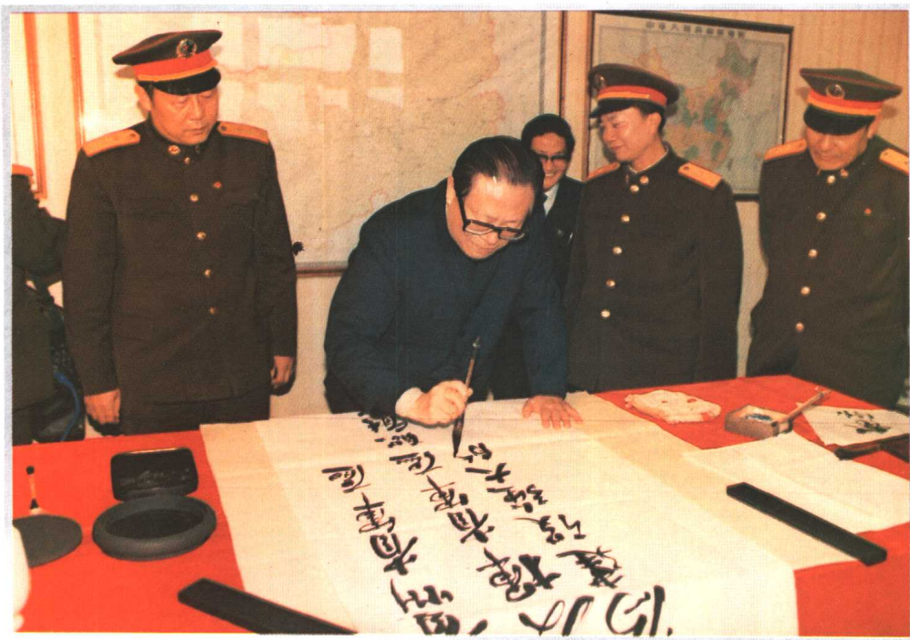
1991年12月25日，中共中央总书记、国家主席、中央军委主席江泽民视察贵州省军区时题词。