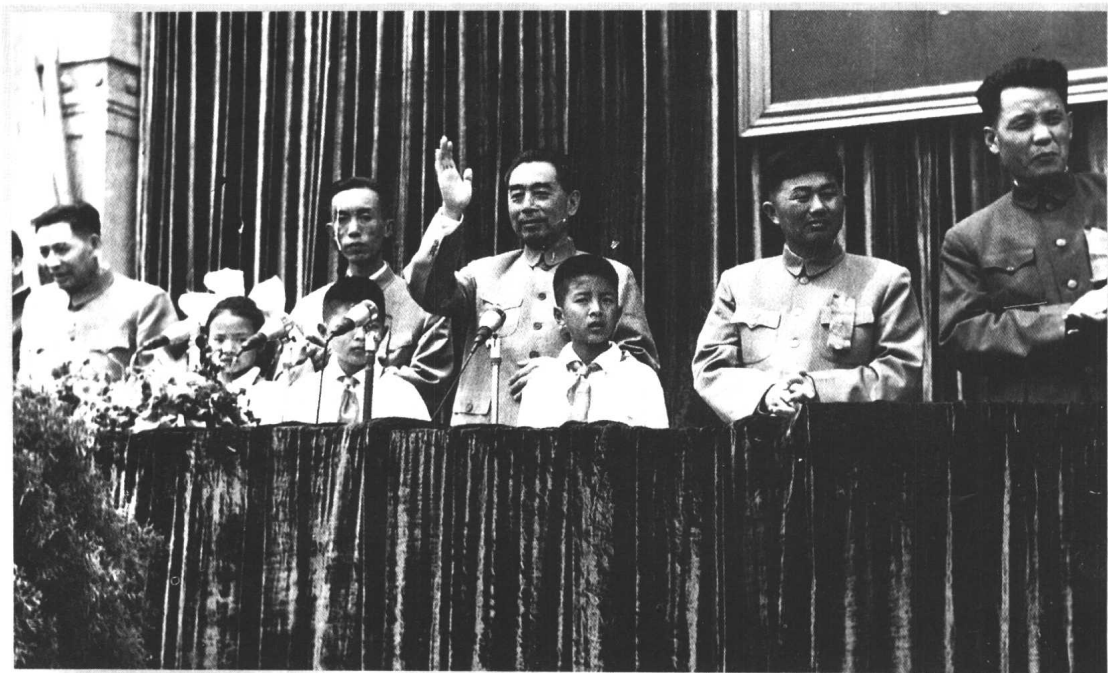
1960年，国务院总理周恩来与省、市党政军领导暨广大军民在贵州军区大操场欢庆“五一”劳动节。