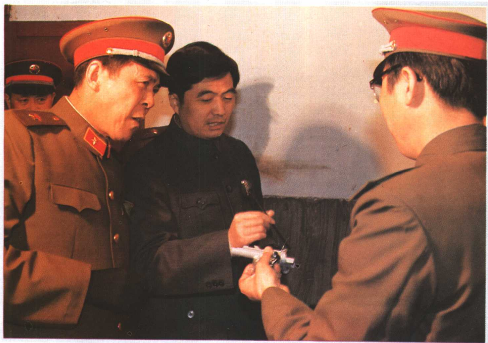
中共中央政治局常委胡锦涛，在任中共贵州省委书记时于1987年4月视察省军区修械所。