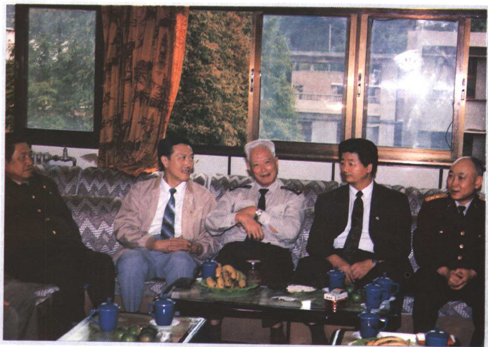
1993年9月15日，中央军委副主席张震（中）与中共贵州省委书记刘方仁（右二）、省长陈士能（左二）亲切交谈。