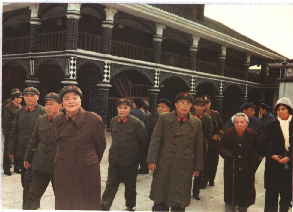
1985年2月，中央军委副主席杨尚昆视察遵义军分区时参观“遵义会议会址”。