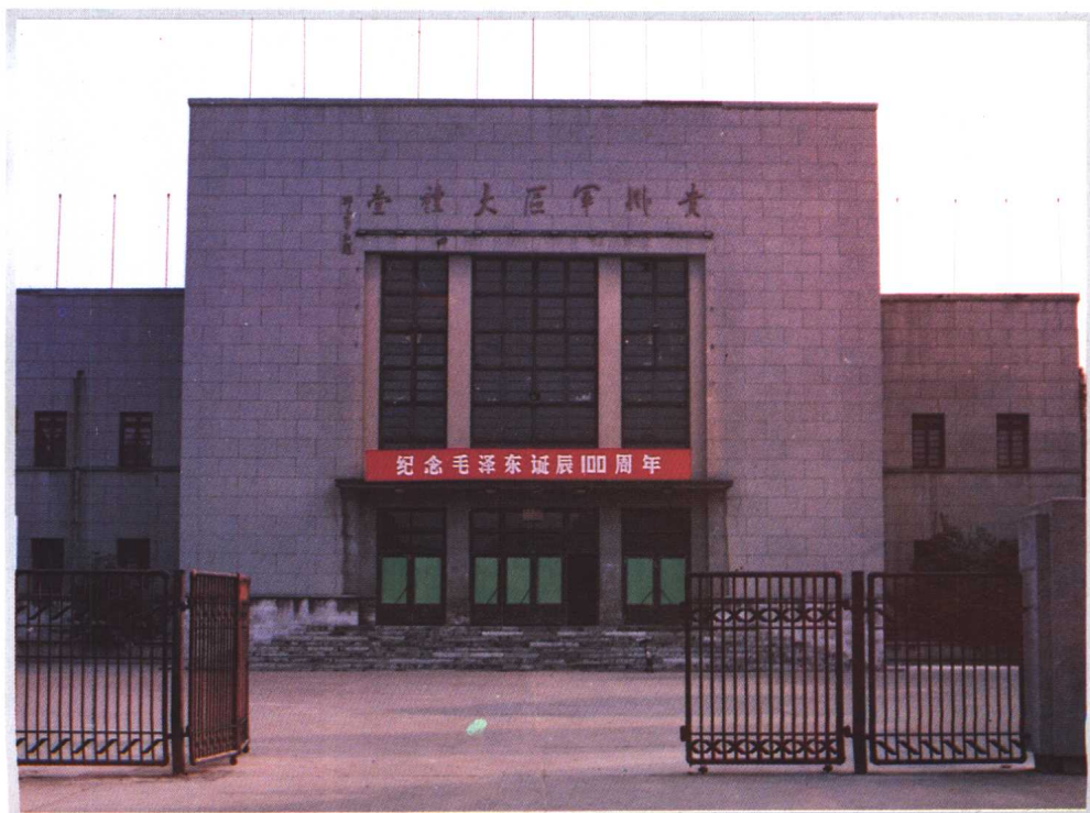
一九五一年邓小平题名的贵州军区大礼堂