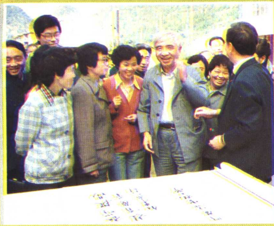
国家教委副主任何东昌（前右二）在贵州电视大学视察，并题词。（1987年9月）