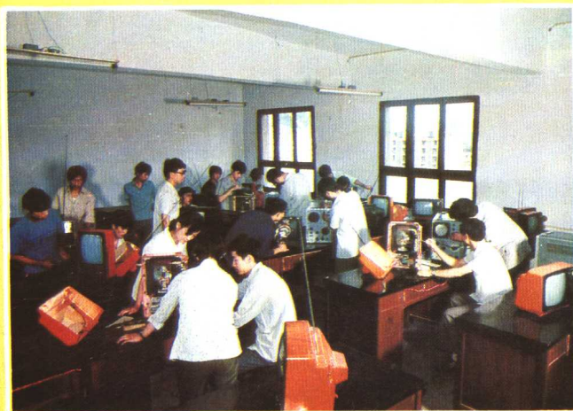
省商业学校学生在修理电器。