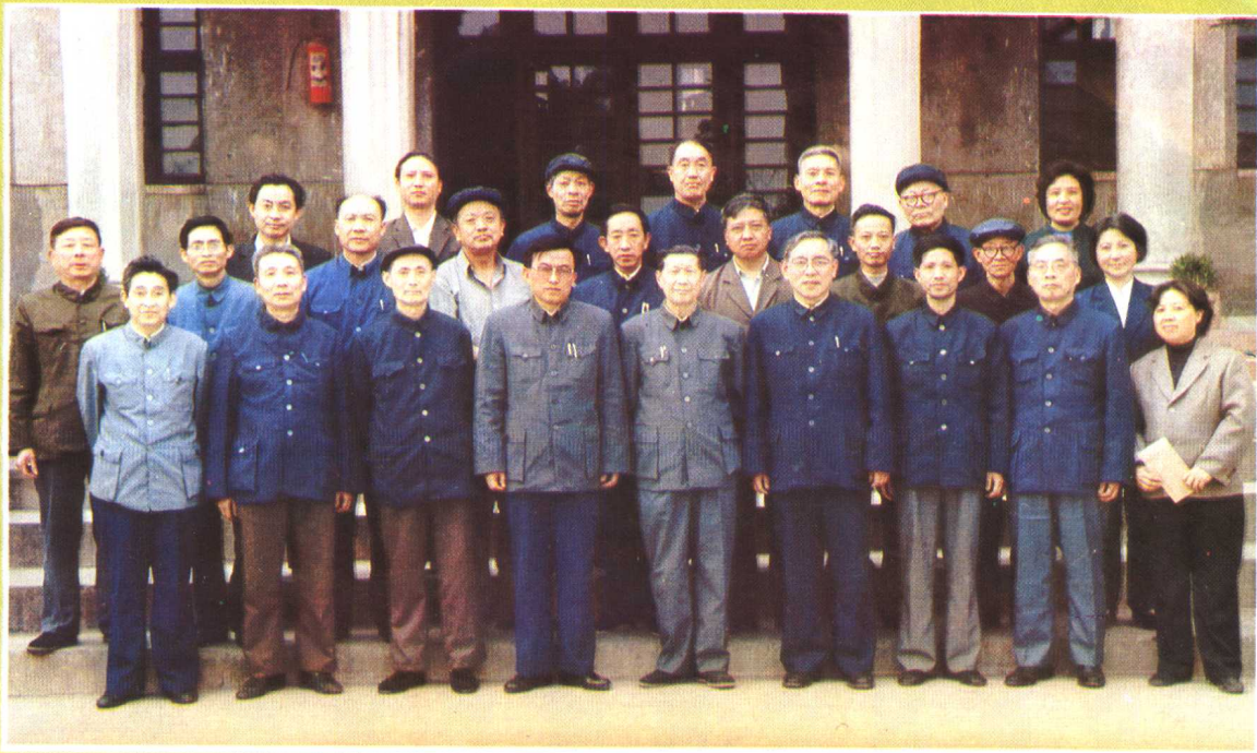
参加《贵州省志·教育志》篇目审定会人员合影。前排左四为省委副书记、省教委主任丁廷模，左五为省地方志编纂委员会副主任委员王虎文。 (1987年4月10日)