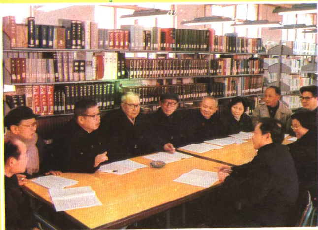
贵阳中医学院老中医基金会的老中医在开会。