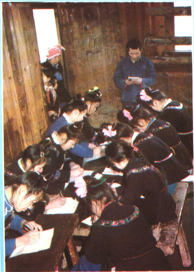
雷山县教育局在西江水寨扫 盲班举行脱盲考试。