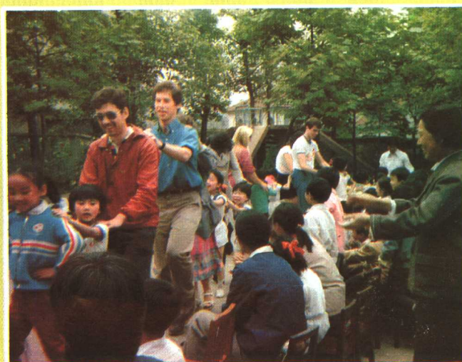
1986年6月10日，美国青年朋友与贵阳市实验小学幼儿园小朋友联欢。