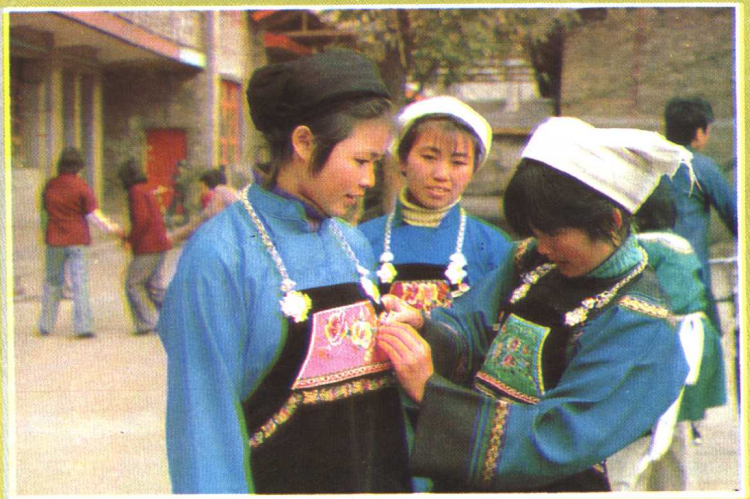
三都民族师范学校水族学生在学习刺绣。