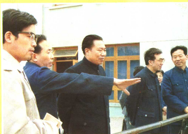
1986年3月24日，国家教委副主任柳斌（左三）到贵阳幼儿师范学校视察。