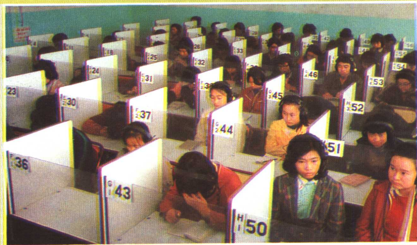
贵阳一中学生在上语言实验课。