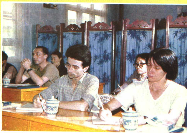
在贵阳医学院学习的法国留学生在听针灸课。（1986年）