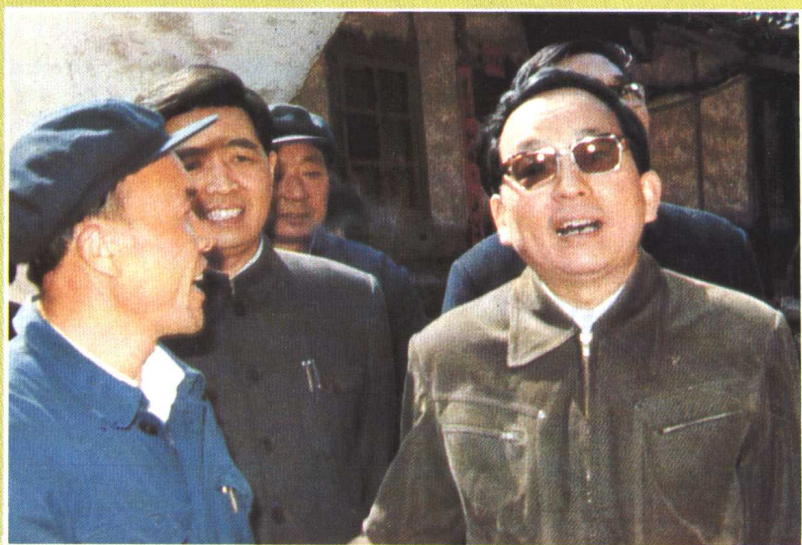
在全国扫盲工作会议上，中共中央政治局委员、国务委员、国家教委主任李铁映（右一）与我省扫盲先进县代表——松桃苗族自治县副县长龙再英（左一）亲切交谈。（1988年11月2日）