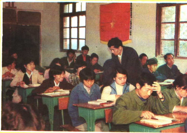
贵阳市花溪区中师广播函授站教师在给农村小学教师上辅导课。