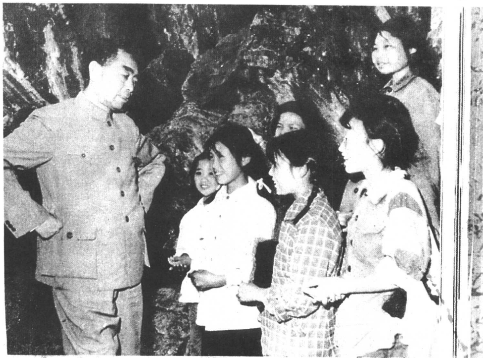
1960年4月，周恩来总理在花溪公园和贵阳一中下乡劳动的学生亲切交谈。