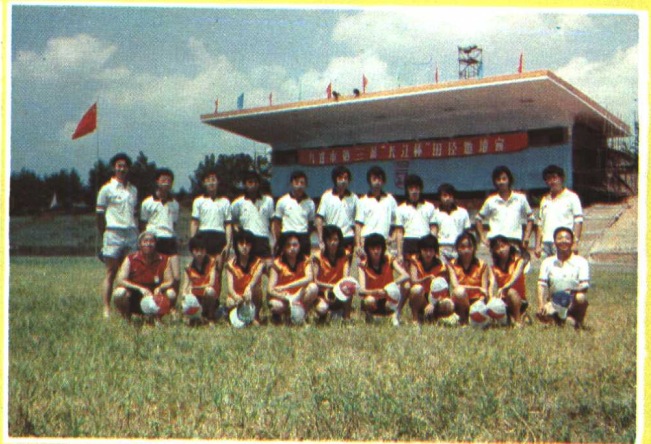
1986年，毕节一中初中田径队参加在湖南株洲市举行的“九省市长江杯田径赛”，获男100米第一名、200米第二名、400米第三名，初中男子组总分第四名。图为队员及教练合影。