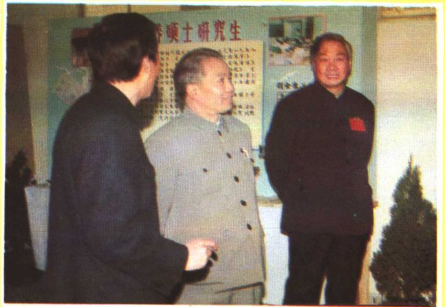
省长王朝文（中）参观贵州工学院科技成果展览。（1986年12月）