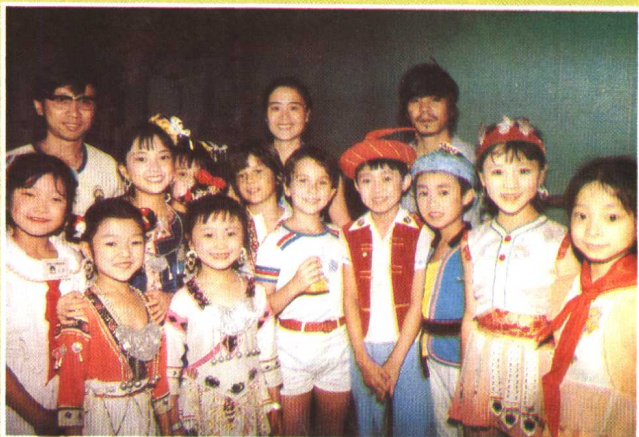
南明区少年宫“苗苗艺术团”在北京儿童活动中心与保加利亚儿童艺术团同台演出后合影。(1986年)