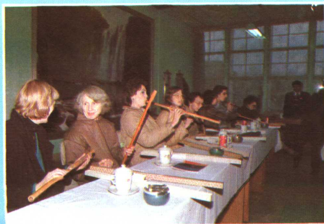
1987 年元旦，省教委、省外事办宴请在我省 高等学校工作的外国专家，并每人赠给一只玉屏 箫、笛。