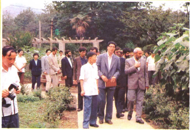
1987年6月18日，伊朗教育代表团到贵阳市实验小学参观。图为代表团正在参观该校生物园。