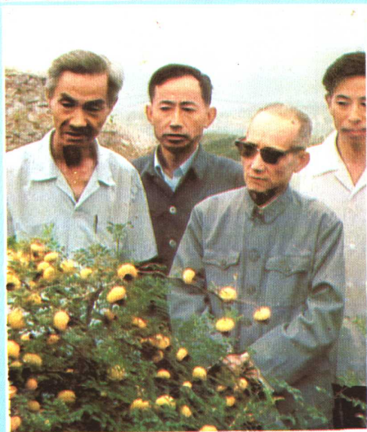
刺藜 (前右) 与该院科研组同志正在研究人工栽培 贵州农学院名誉院长、一级教授罗登义