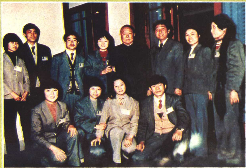
1984年12月，贵阳市旅游学校学生在花溪宾馆实习时，与国家主席李先念（后排右四）合影。