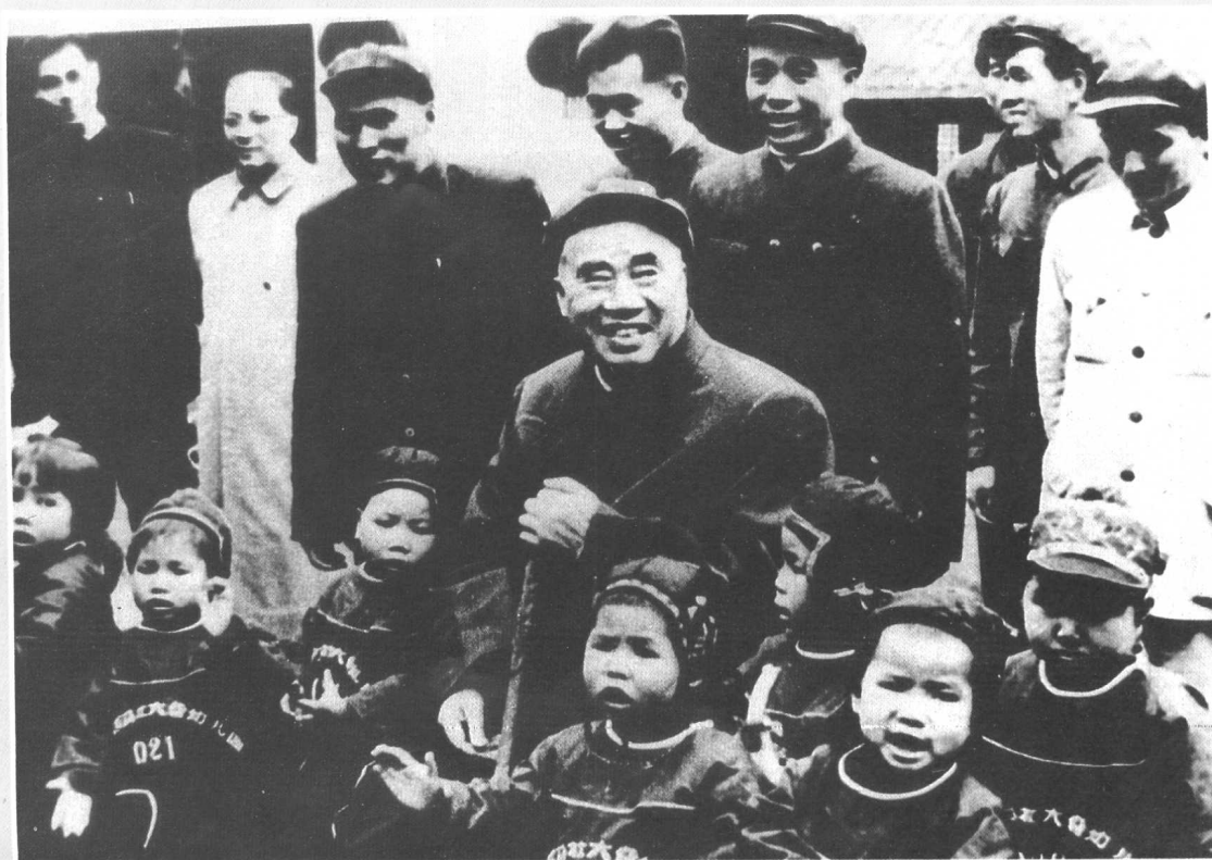
1960年2月，朱德委员长（中座者）视察花溪大队幼儿园。