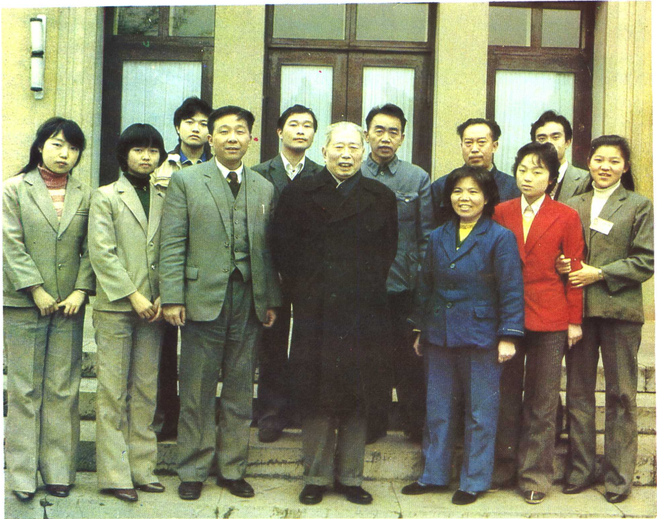
1985年3月，中共中央政治局委员宋任穷（前右四）在花溪宾馆与贵阳市旅游学校在宾馆实习的学生合影。