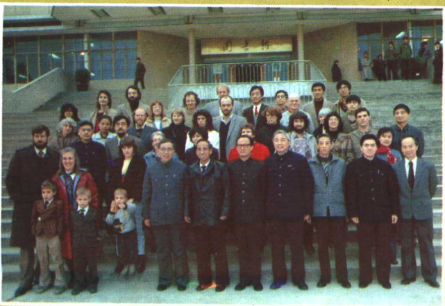
1987元旦，省教委、省外事办宴请在我省高等学校工作的全体外国专家。图为宴会前在贵州工学院图书馆前合影。