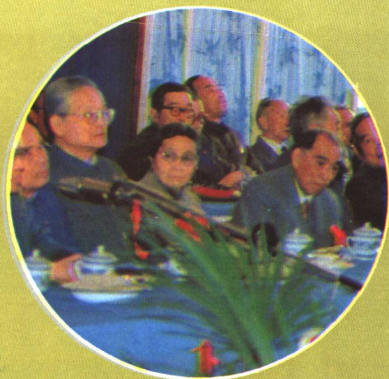
贵阳医学院召开老教师执教从医五十周年庆祝大会。（1987年）