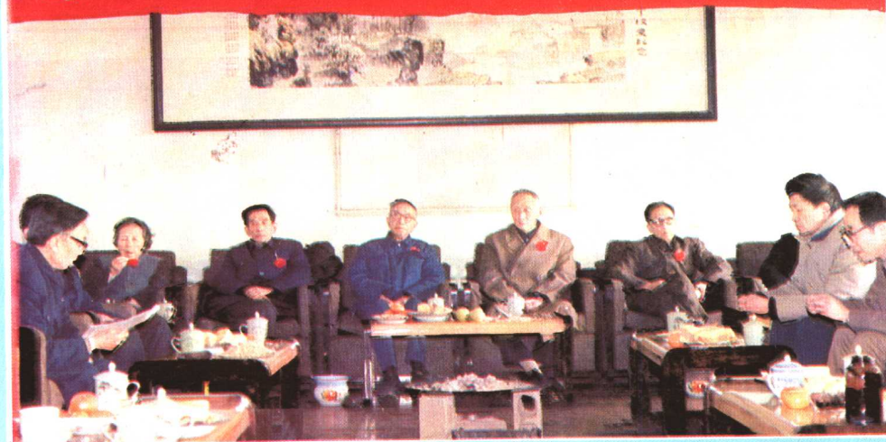
中国民主同盟贵州师大支部 向执教 45 周年以上的盟员祝 贺，学校党政领导参加祝贺。 (1987 年)