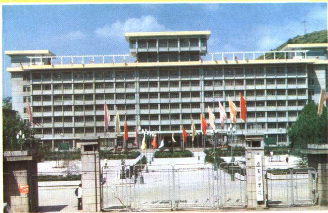
1969年，大连医学院南迁至贵州遵义，改名遵义医学院。图为遵义医学院教学大楼。