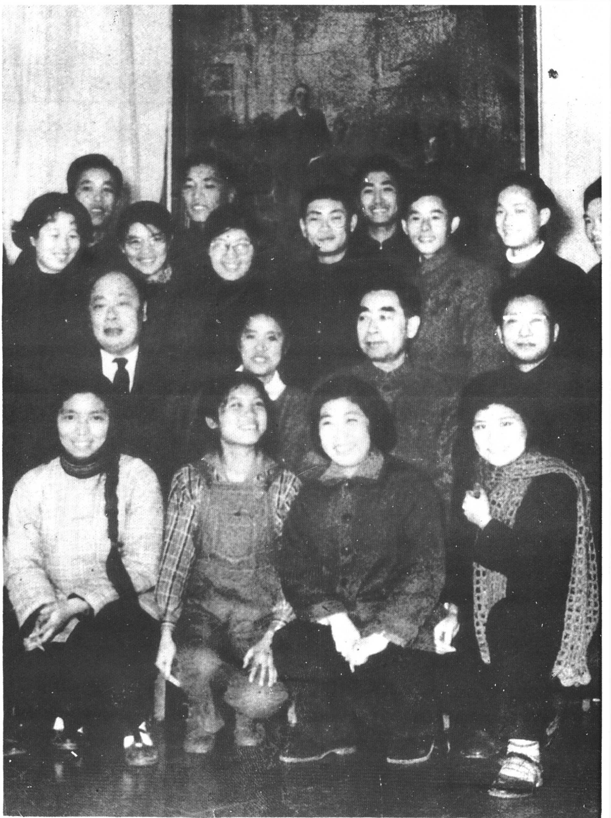
1960年，周恩来总理（二排右二）、陈毅副总理（二排左一）接见贵阳甲秀小学少先队辅导员和教师。