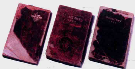
金子美铃诗集手稿