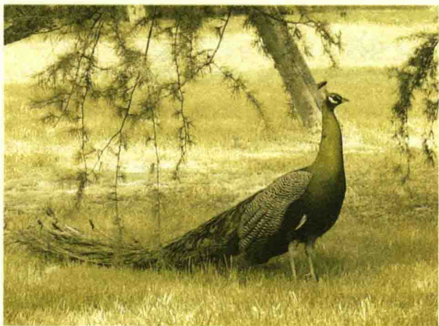
被称为“百鸟之王”的美丽、灵动的孔雀