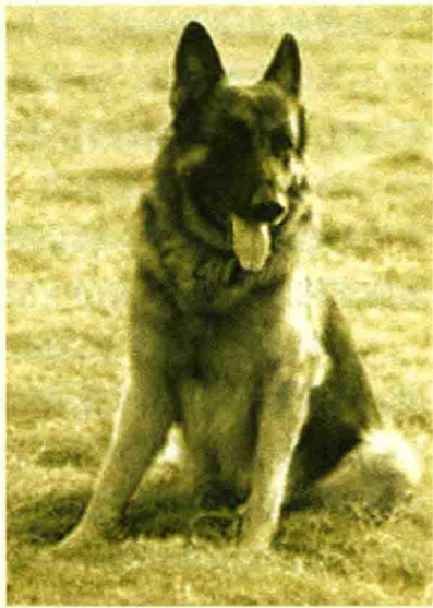
狗——人类最忠实的朋友

正在这危急时刻，在人群不远处，一只正和主人一起散步的狗，突然意识到什么似的，猛然挣脱主人手中的绳子，钻进人群，扑到正在冒烟的手榴弹上。刹那间爆炸声响起，众人吓得半天才回过神来，却看到这只仁勇的