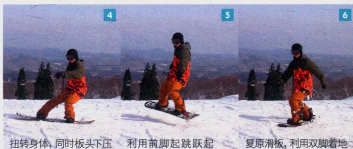
4 扭转身体，同时板头下压