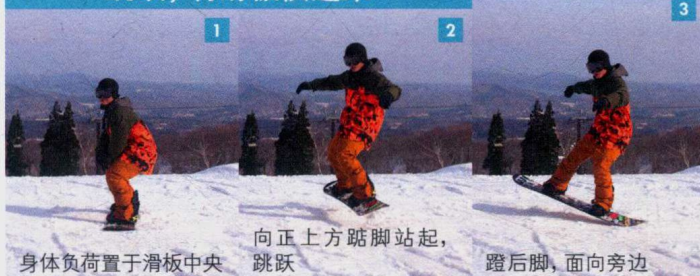
1 身体负荷置于滑板中央