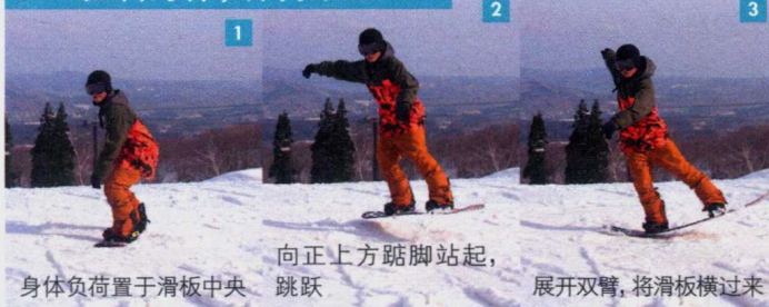
1 身体负荷置于滑板中央