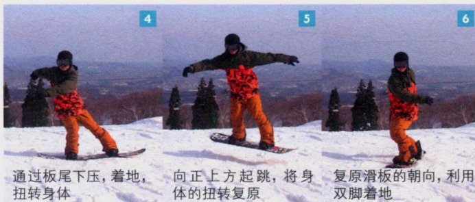
4 通过板尾下压，着地，扭转身体