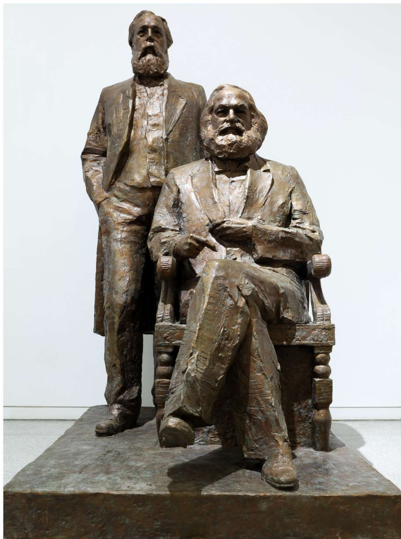
马克思和恩格斯（雕塑） 吴为山